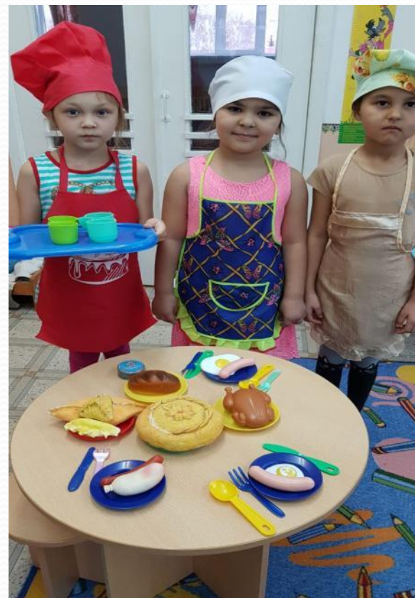
Сюжетно -ролевая игра «Столовая»