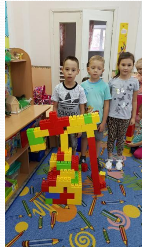
Конструирование. «Буровая вышка и качалка»