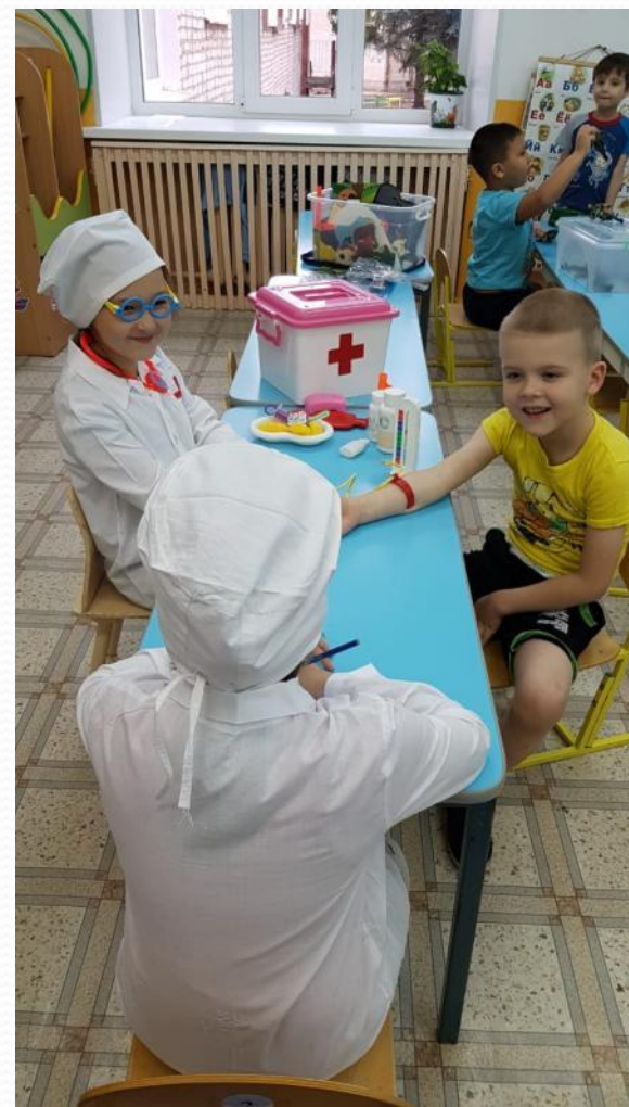
Сюжетно -ролевая игра «Медпункт»