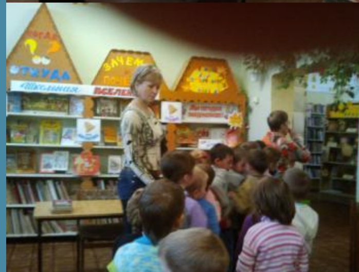
Знакомство детей с профессией библиотекаря.