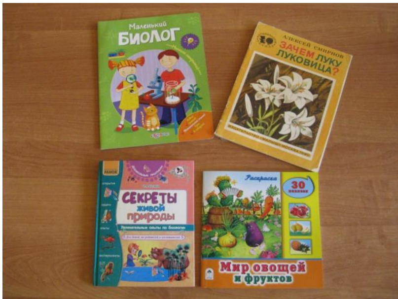
Книги об овощах