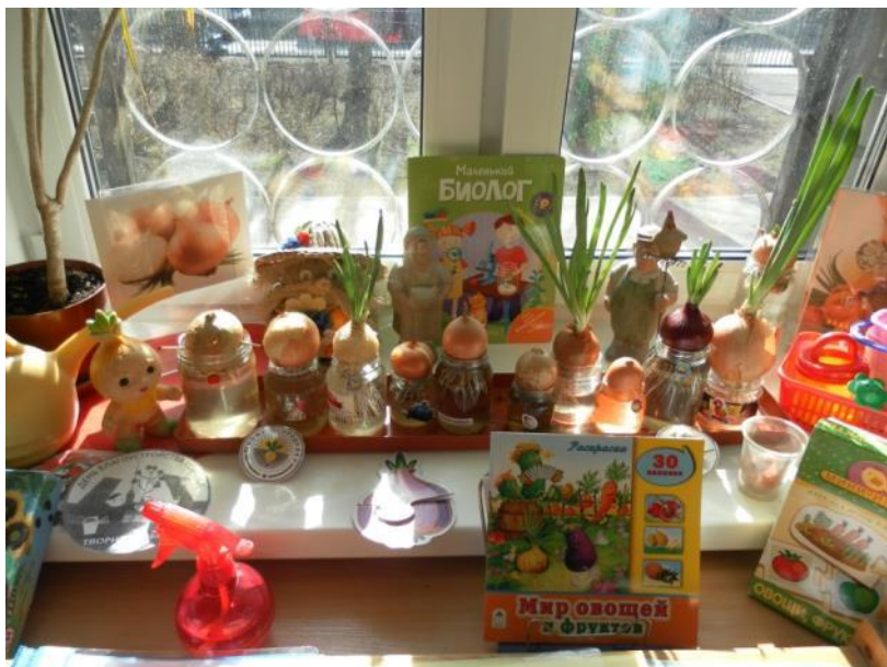
«Огород на подоконнике»