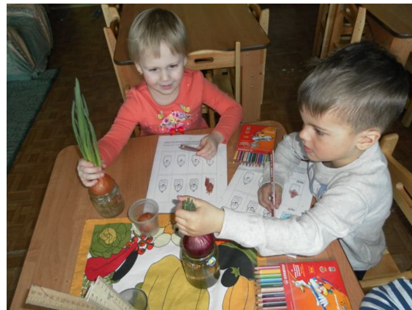
«Витамины в тарелке»