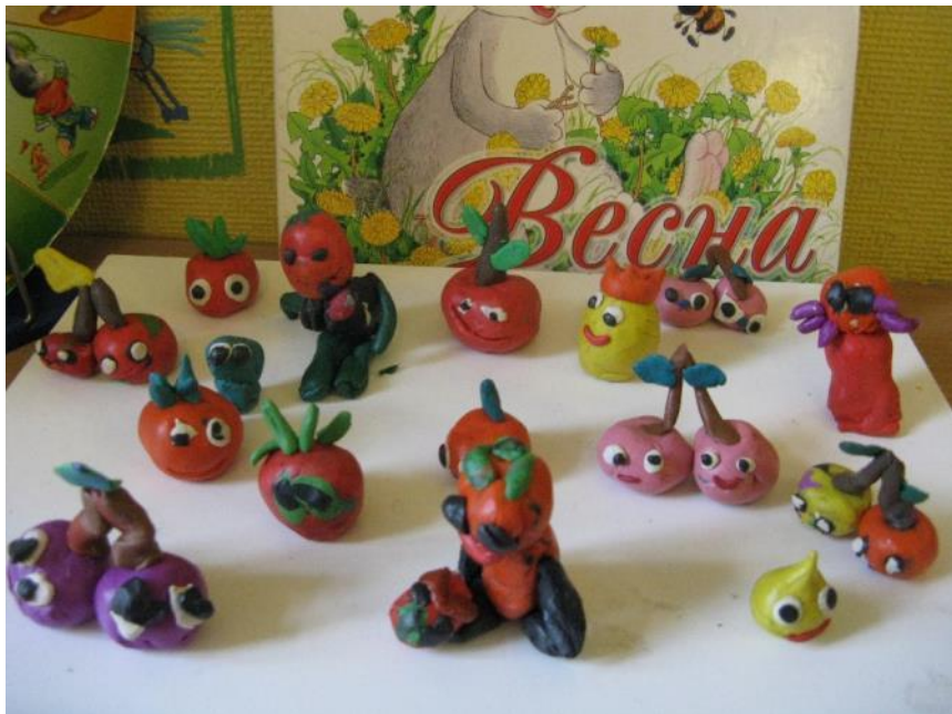
Рисование, лепка, конструирование по сказке «Приключения Чиполлино»