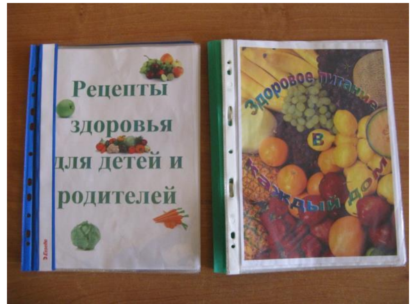
Информационный материал для детей и родителей