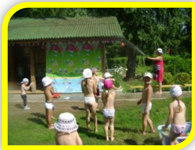
Солнце воздух и вода наши лучшие друзья