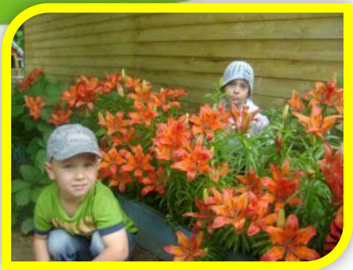
Цветы на нашем участке