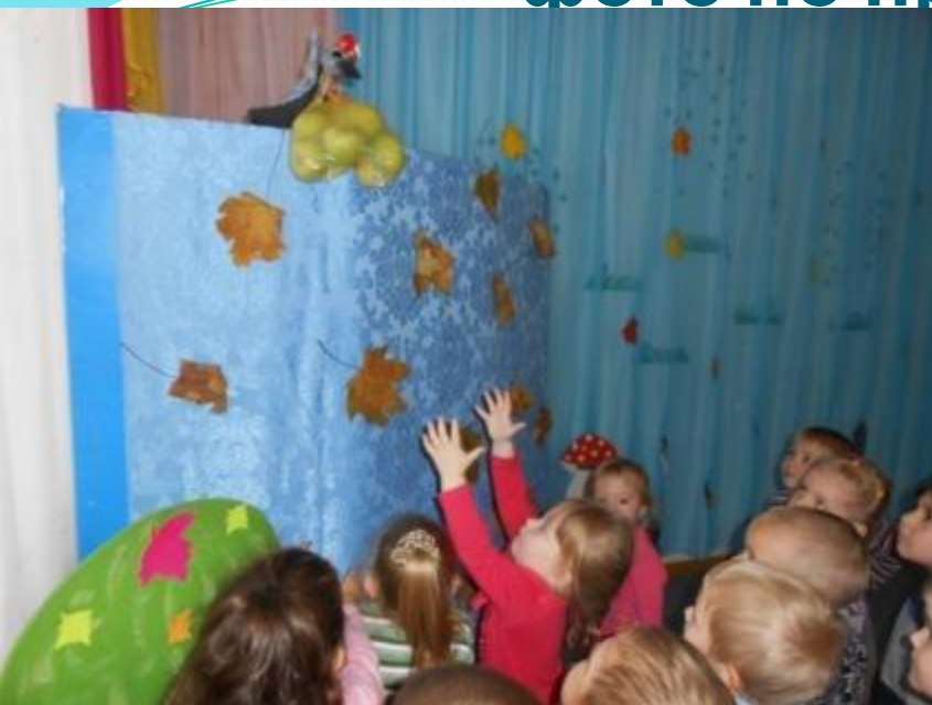
фото по проекту «Птицы»