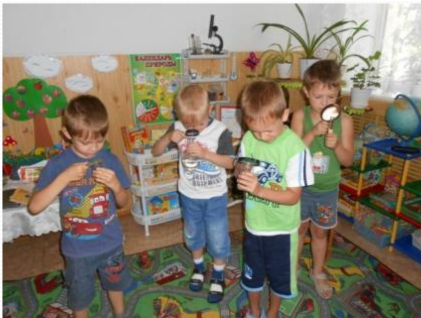
фото по проекту «Волшебница вода»