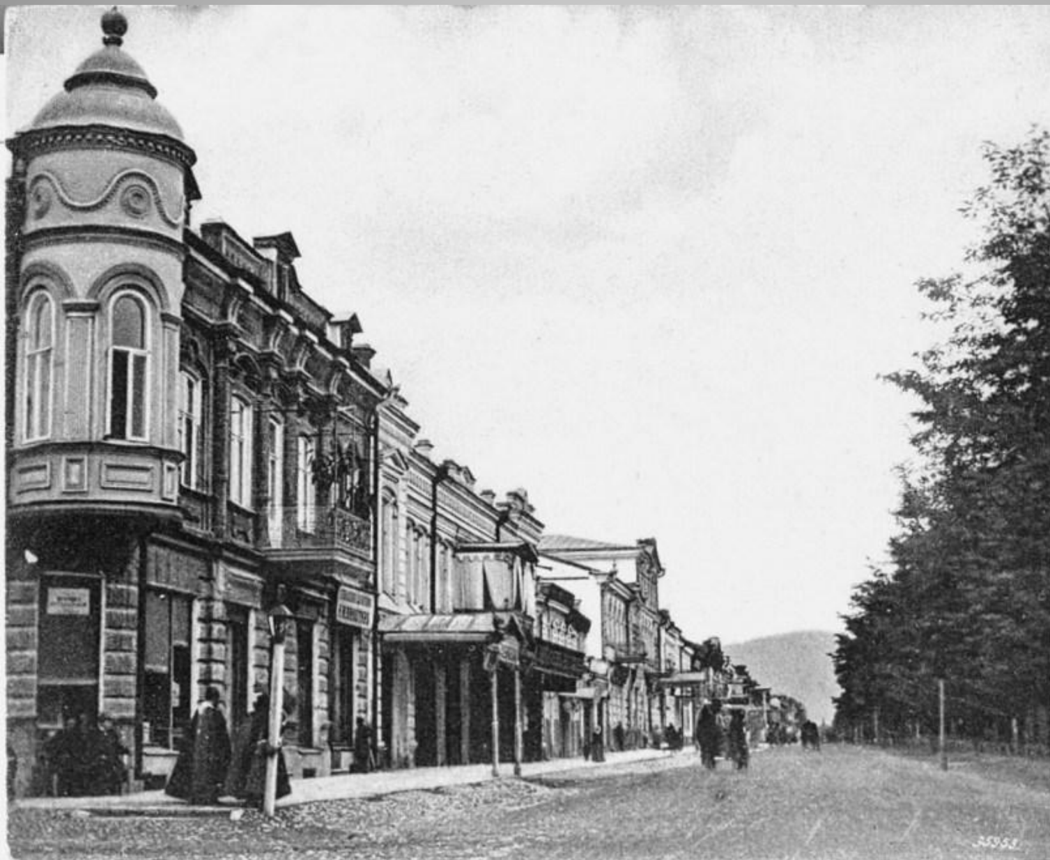
Владикавказъ. Александров- скій Проспектъ.