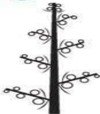
Схема сложного колоса