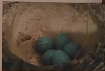
Весной снегيري строят гнездышки в виде чаши, внутри выстилают их веточками и листьями. Самочка откладывает небольшие яйца голубого цвета с темными пятнышками.