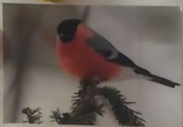
Снегири – небольшая певчая птичка чуть больше воробья.