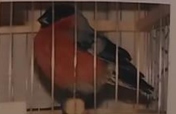
Снегирей разводят в неволе как певчих птичек, но их ценят больше за похожесть на скрин или свист.