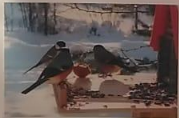
С наступлением холодов снегيري перебираются ближе к человеческому жилью, туда – где можно отыскать пищу.