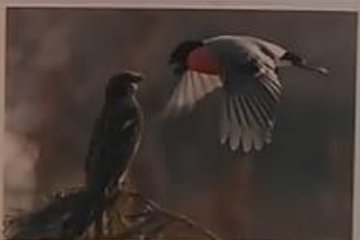
По характеру снегيري спокойные и осторожные птицы. Они никогда не дерутся за корм, но если к их гнезду приближается противник, то снегирь смело защищает свою семью.