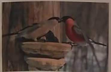
Снегири – однолюбы, они создают пару один раз на всю жизнь. Самочка считает себя главной и самец уступает ей лучшие зернышки и уютное место на ветке.