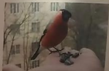
Мой дедушка любит фотографировать снегирей. Когда я приезжаю зимой в Екатеринбург, мы ходим с ним в парк кормить снегирей семечками и наблюдать за ними.