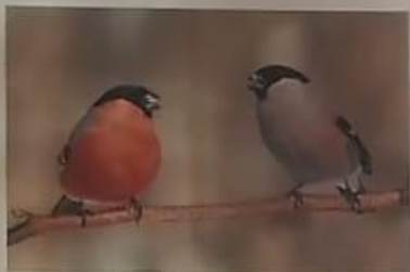
Голова, крылья и хвостик у него черные. У самцов перышки на груди ярко-красного цвета, у самок – грудка серовато-коричневая.