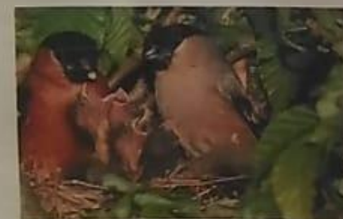
Своих птенцов родители кормят не только семенами, а еще сочными ягодами и мелкими насекомыми.