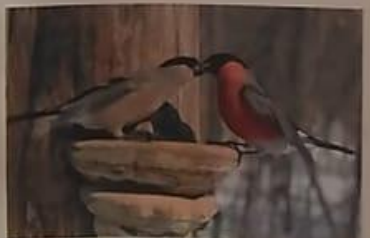
Снегيري – однолюбы, они создают пару один раз на всю жизнь. Самочка считает себя главной и самец уступает ей лучшие зернышки и уютное место на ветке.