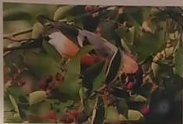
В теплое время года снегيري живут в густых лесах, где всегда для них много еды.