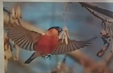
Снегيري питаются сухими семенами и почками деревьев.