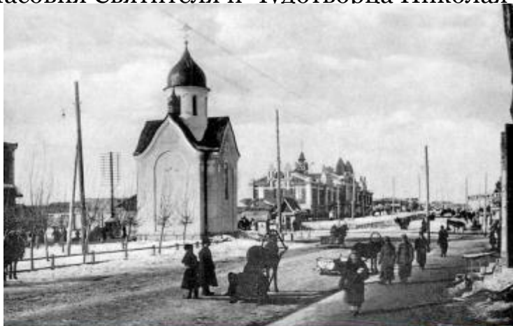
Часовня Святителя и Чудотворца Николая

Задание - к старым фотографиям зданий, сооружений надо найти современные фотографии этих же зданий и сооружений, и сравнить, как изменился наш город за последние 100 лет