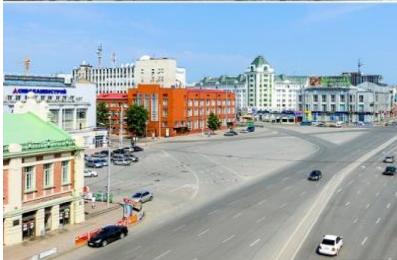
Торговый корпус (сегодня Краеведческий музей)