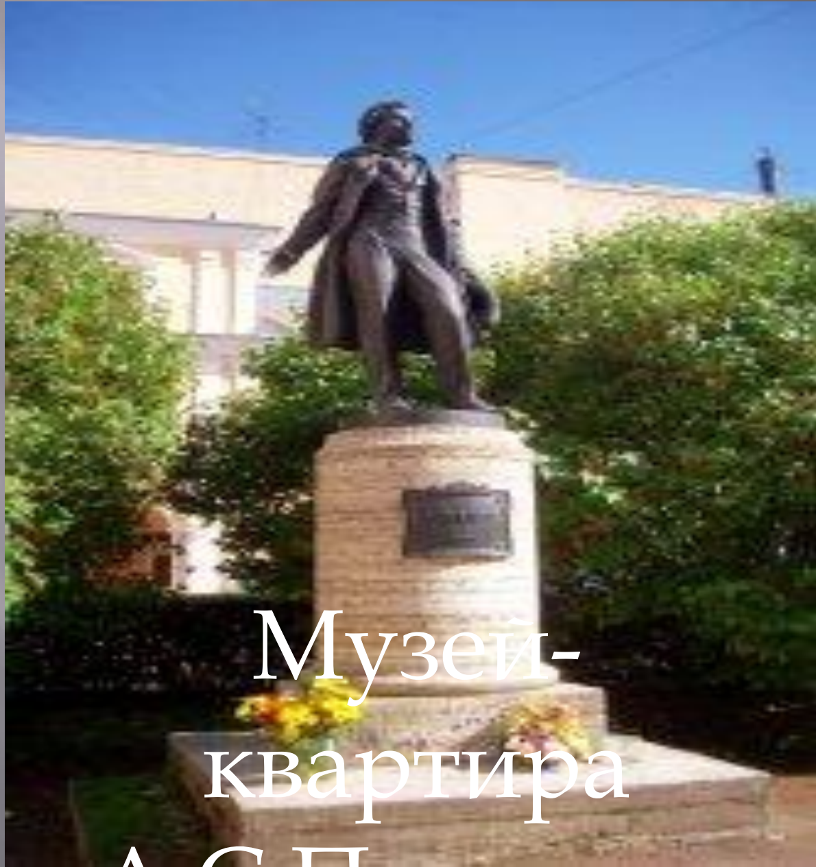
Музей- квартира А.С.Пушкина