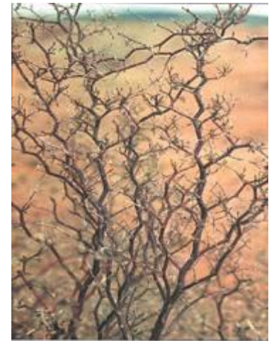
Верблюжья колючка (Alhagi sp.).