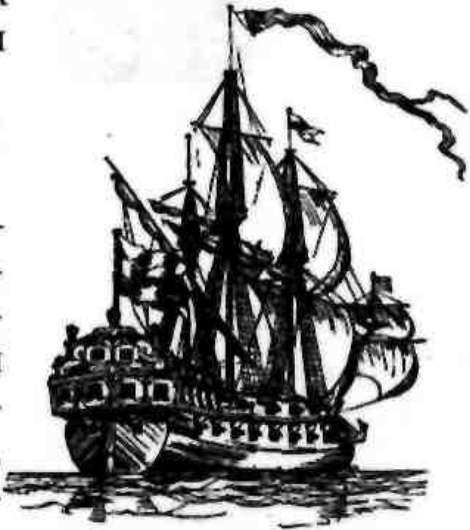
“Крепость” — один из первых кораблей Петра I