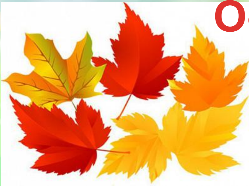
(Осень – жёлтые, оранжевые и красные листья)

Наступает самое разноцветное время года осень. Теплые летние деньки уступают прохладным осенним дням, начинает желтеть и сохнуть трава. На деревьях желтеют листья, а на веточках рябины появляются красные ягоды. Золотятся березы, желтеет дуб, опадает клён и весь лес устелен оранжевым ковром из желтых, красных и других оттенков листьев.