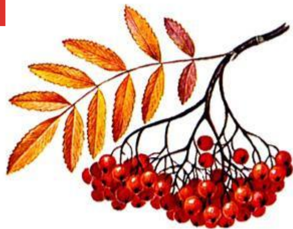
(Осень – красная рябина)

Наступает самое разноцветное время года осень. Теплые летние деньки уступают прохладным осенним дням, начинает желтеть и сохнуть трава. На деревьях желтеют листья, а на веточках рябины появляются красные ягоды. Золотятся березы, желтеет дуб, опадает клён и весь лес устелен оранжевым ковром из желтых, красных и других оттенков листьев.