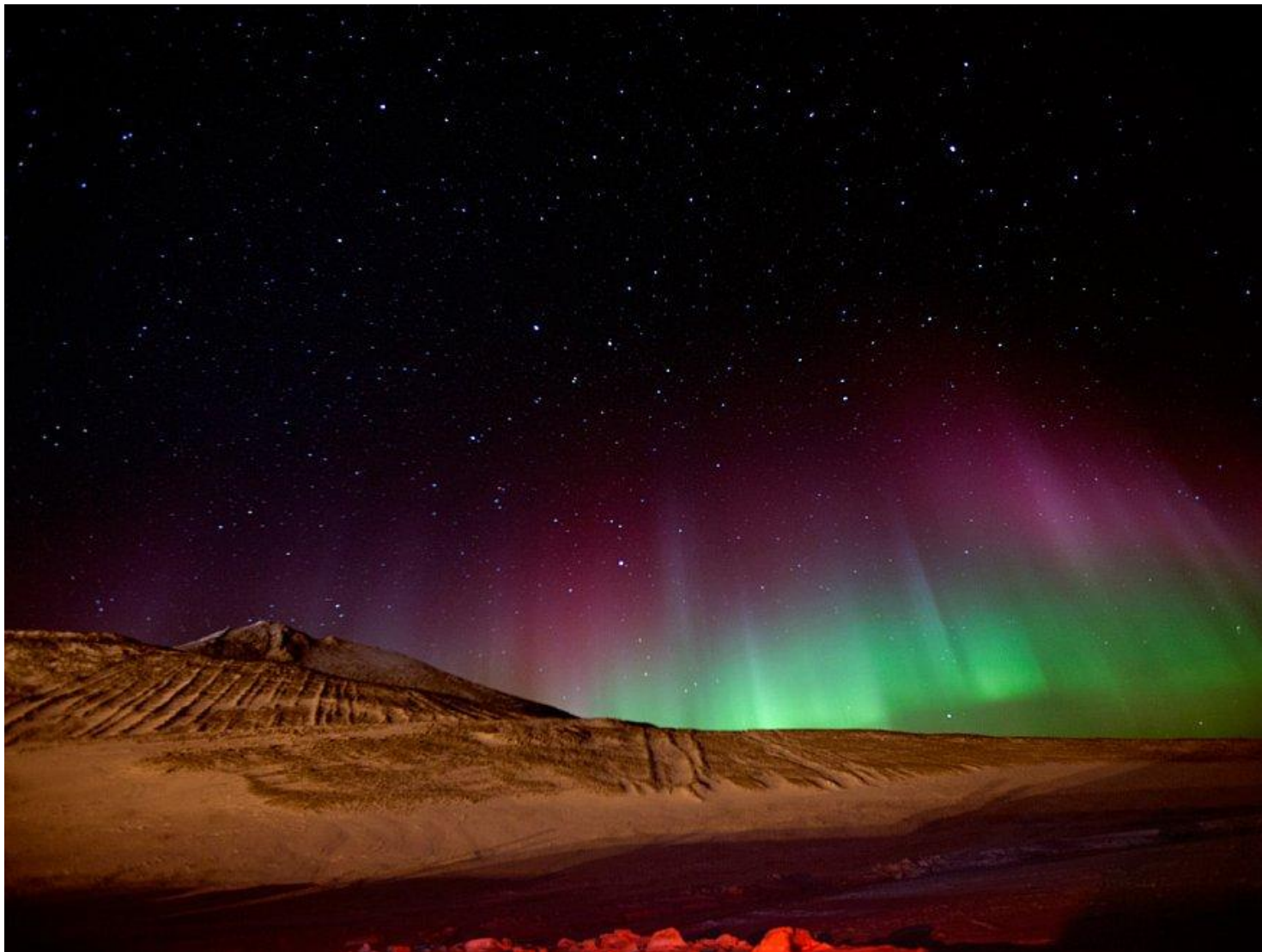
Северное сияние на станции Мак-Мёрдо, 15 июля 2012. Антарктическая станция Мак-Мёрдо — крупнейшее поселение, порт, транспортный узел и исследовательский центр в Антарктике.