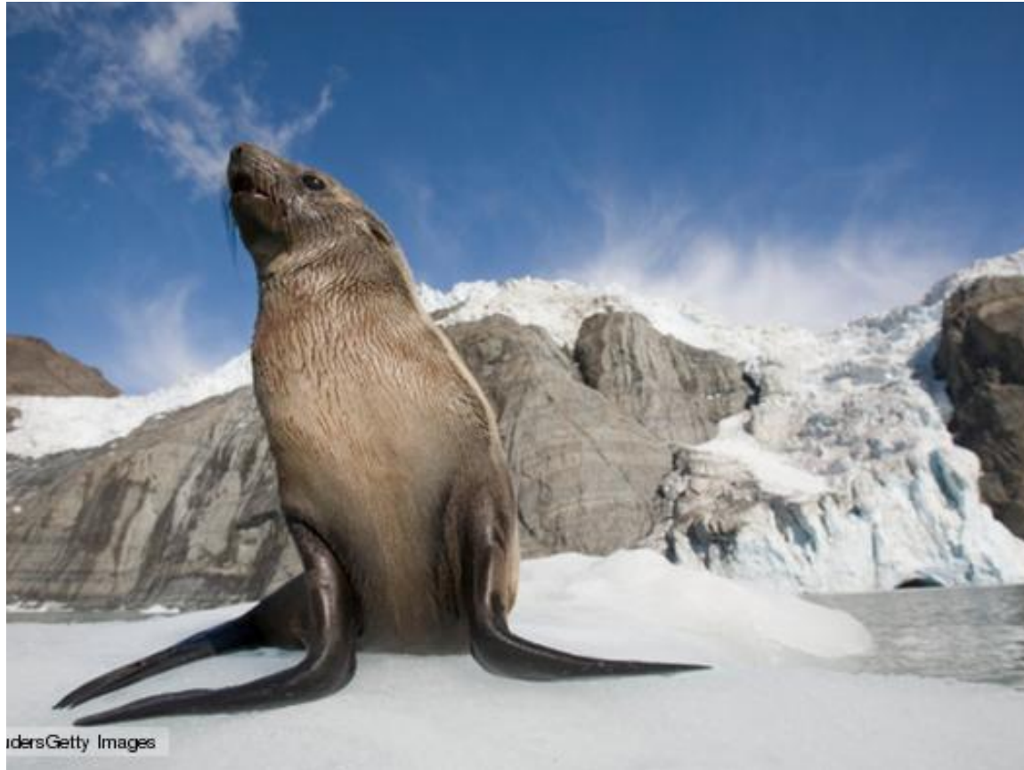
Кергеленский морской котик[1] (лат. Arctocephalus gazella ) — вид южных морских котиков ( Arctocephalus ).