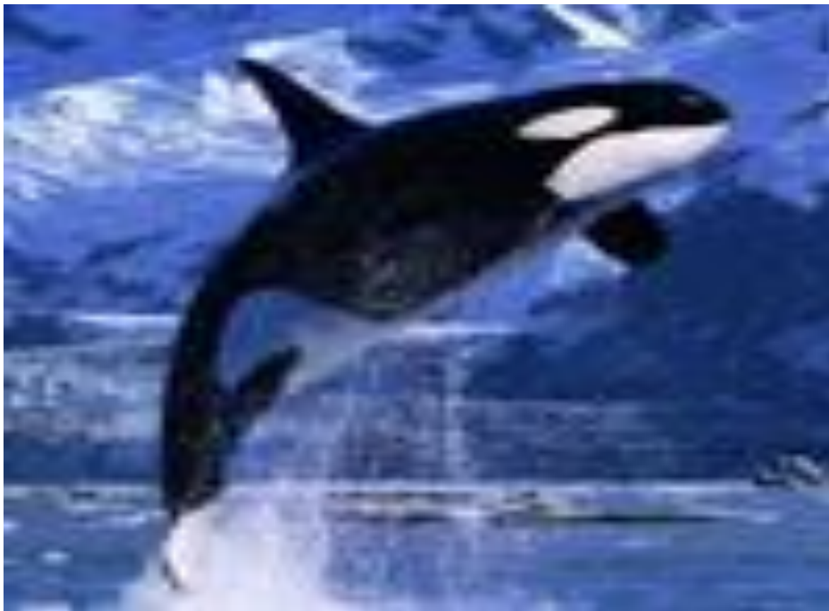
Косатка[1][2] (лат. Orcinus orca ) — водное млекопитающее семейства дельфиновых