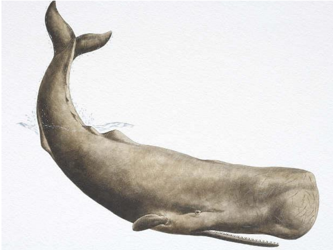
Кашалот (лат. Physeter macrocephalus ; syn. Physeter catodon ) — морское млекопитающее