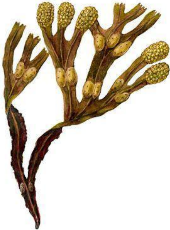
Бурые водоросли. Фукус (Fucus).