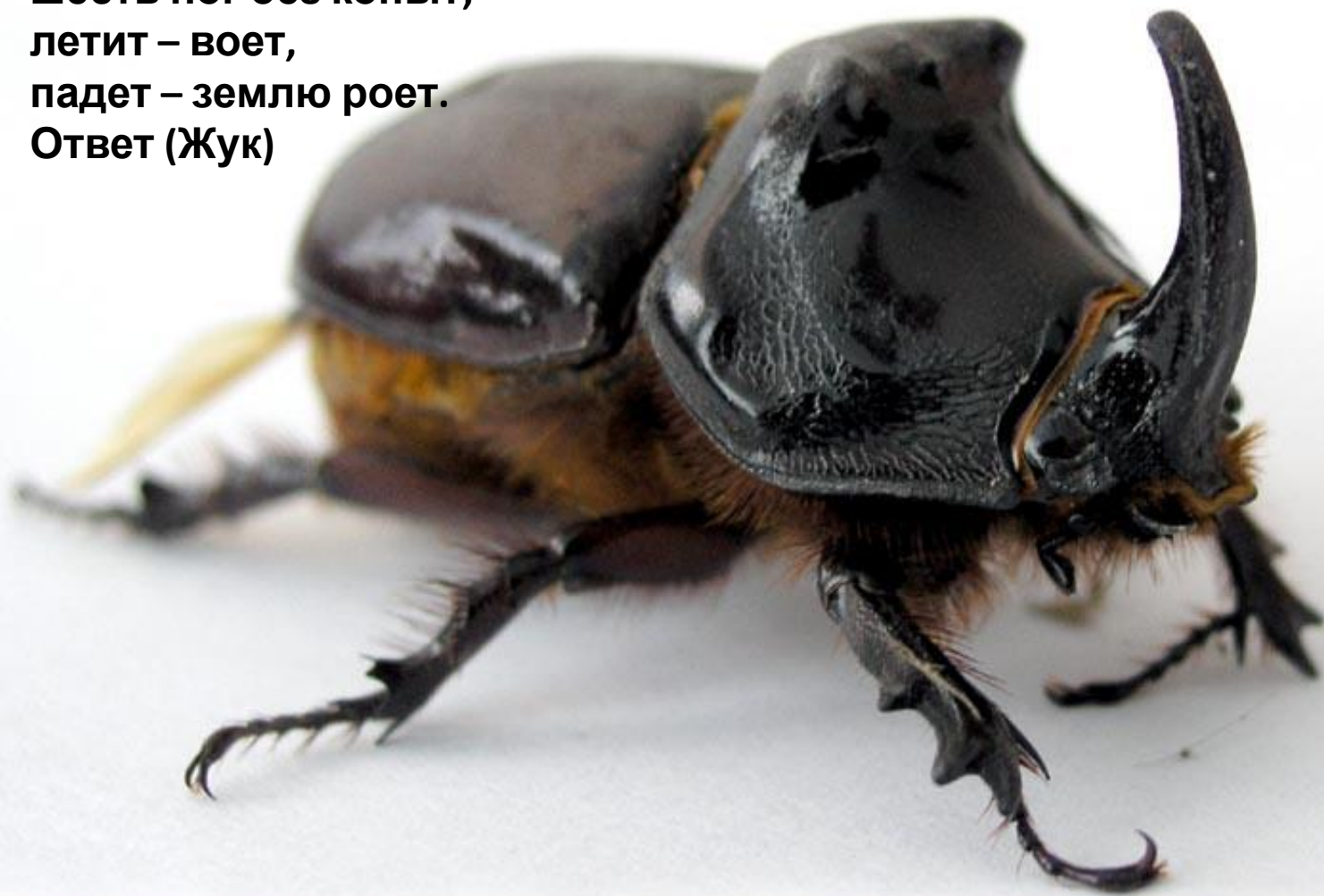
Жук - носорог

Черен, да не ворон, рогат, да не бык, шесть ног без копыт; летит – воет, падет – землю роет. Ответ (Жук)