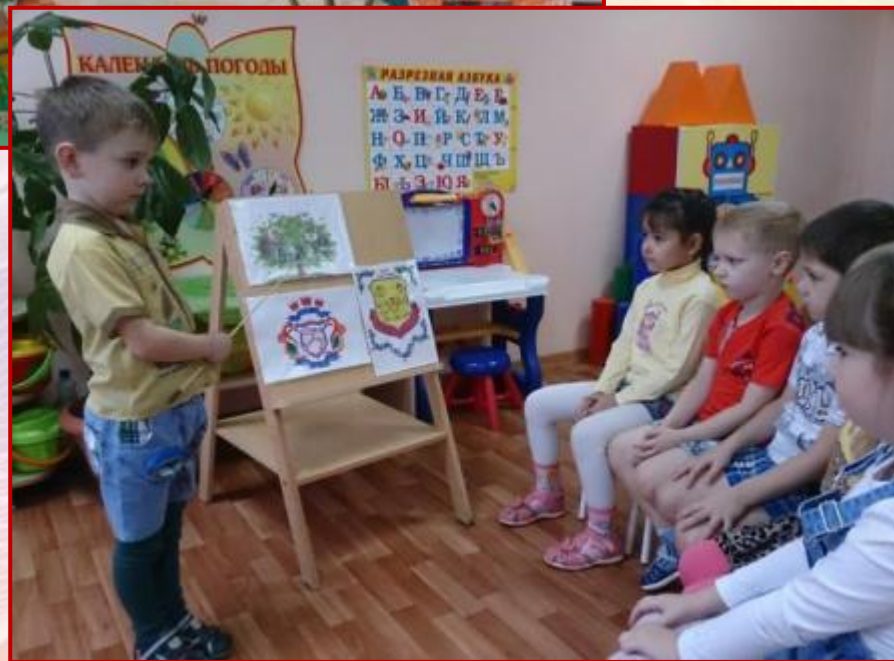
Составление Генеалогического древа