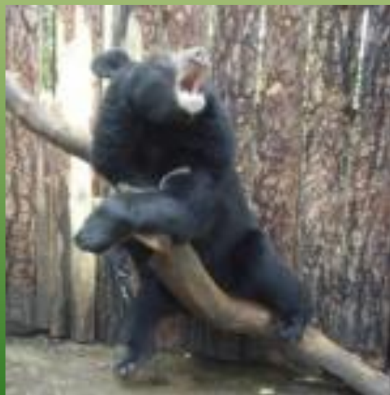
Гималайский медведь Кузьма