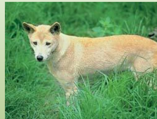
Дикая собака динго.