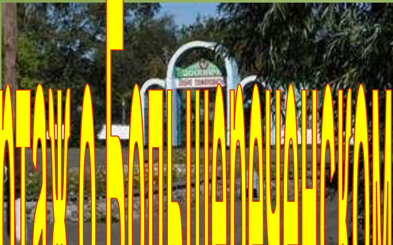
Большереченский зоопарк_Друзья природы_МКОУ «Таскатлинская СОШ» структурное подразделение «Михайловская ООШ»