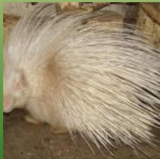
Индийский дикобраз - альбинос.