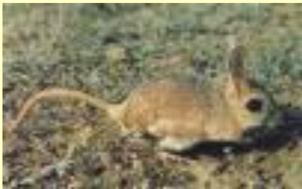
Земляной заяц - тушканчик