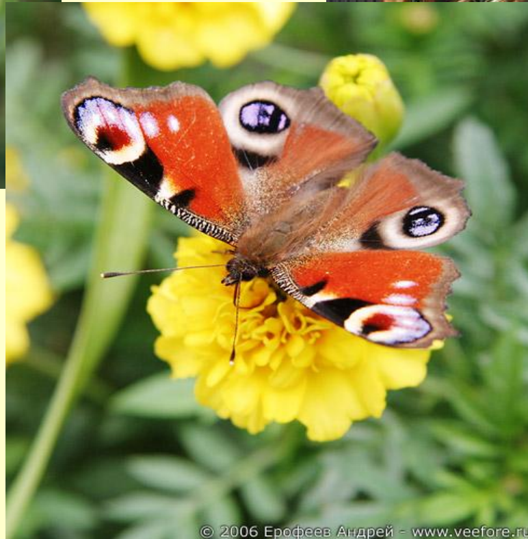
бабочка -павлиний глаз