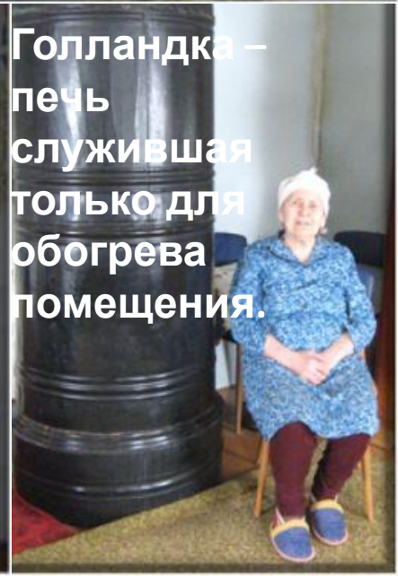
Голландка – печь служившая только для обогрева помещения.