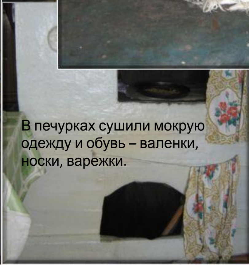
В печурках сушили мокрую одежду и обувь – валенки, носки, варежки.