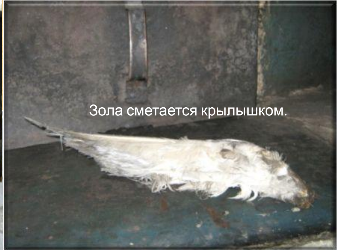
Зола сметается крылышком.