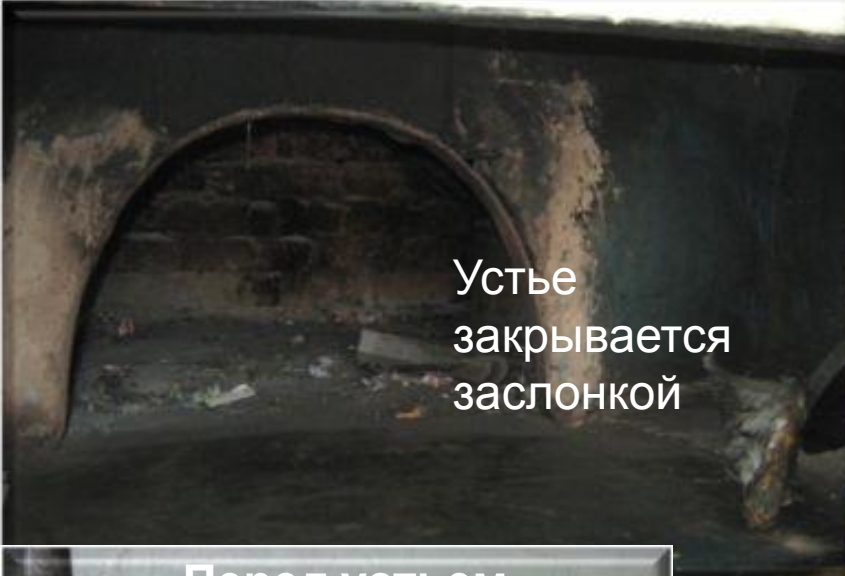
Устье закрывается заслонкой