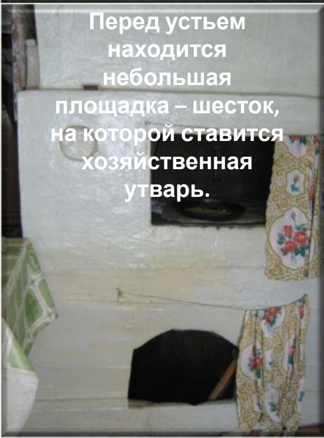
Перед устьем находится небольшая площадка – шесток, на которой ставится хозяйственная утварь.