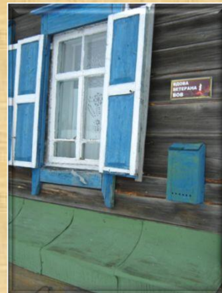
Окно с наличниками