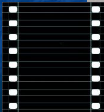
фотоплёнки и киноплёнку