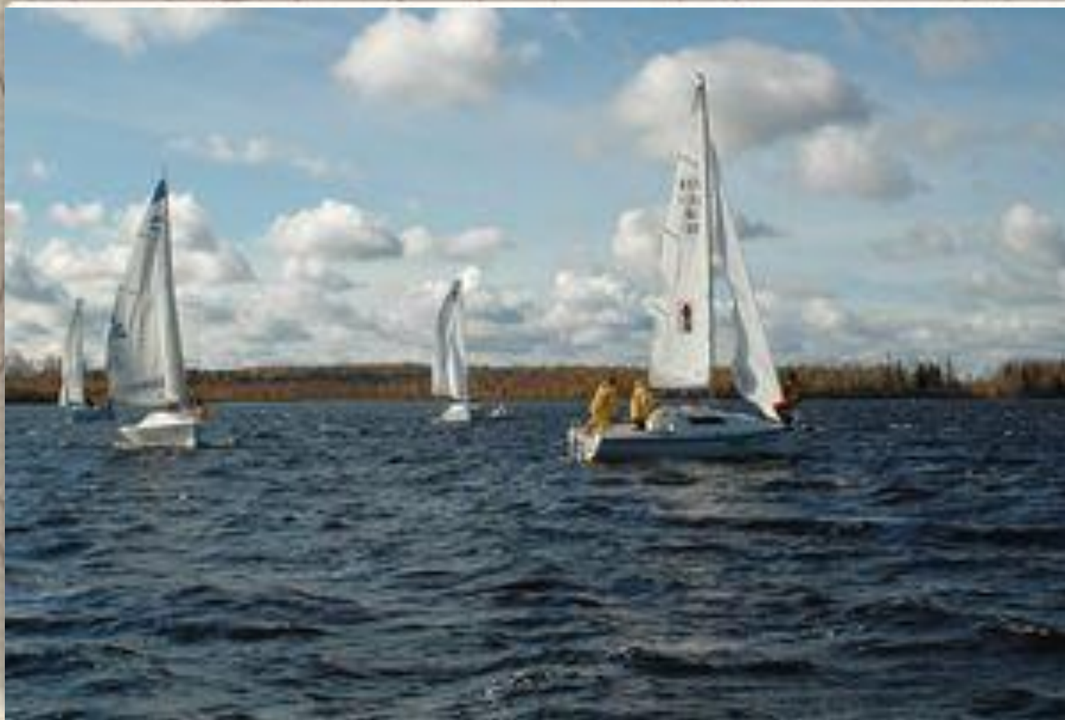
Озеро «Сырковый сор». Регата.