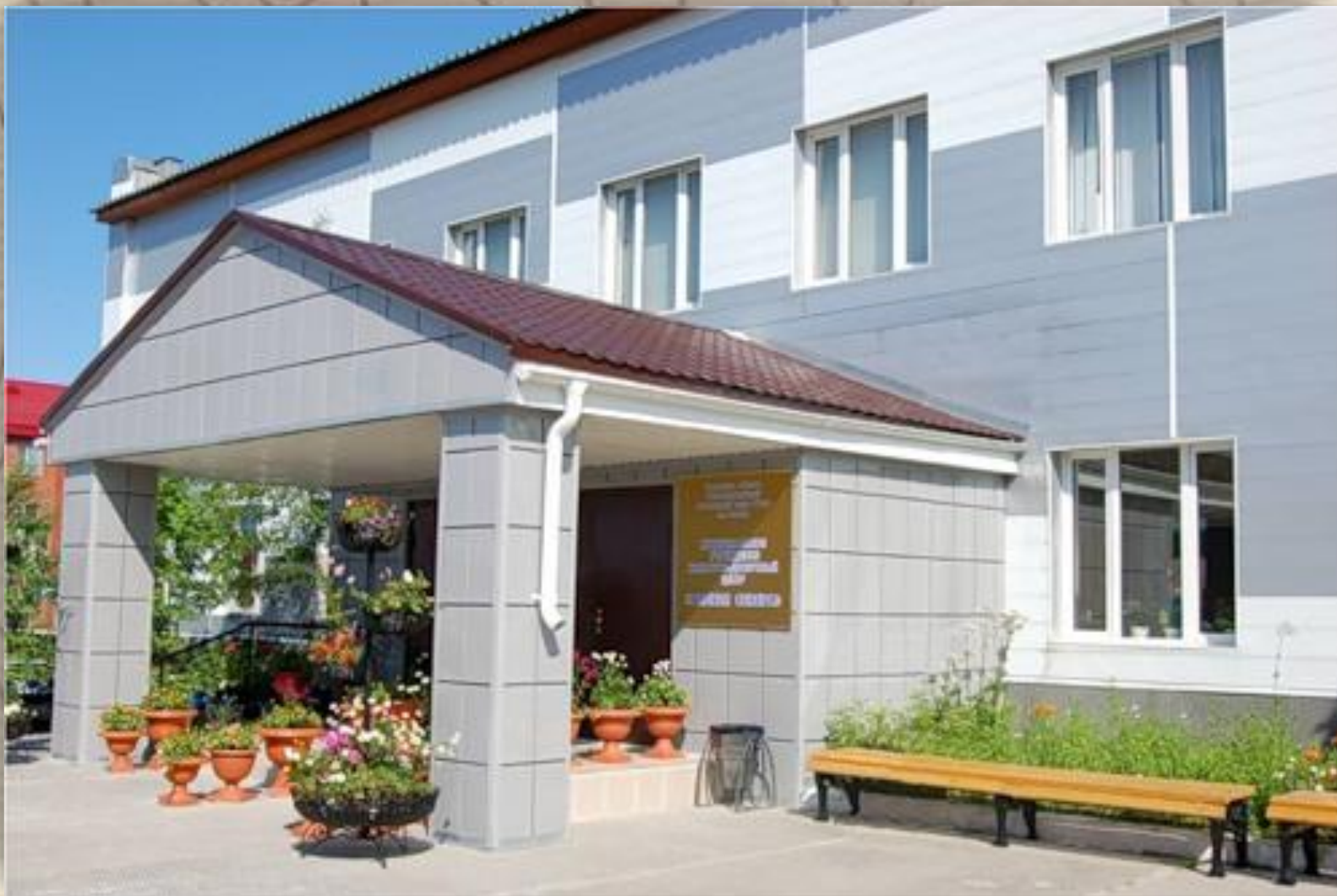
КСК «Сияние Севера»