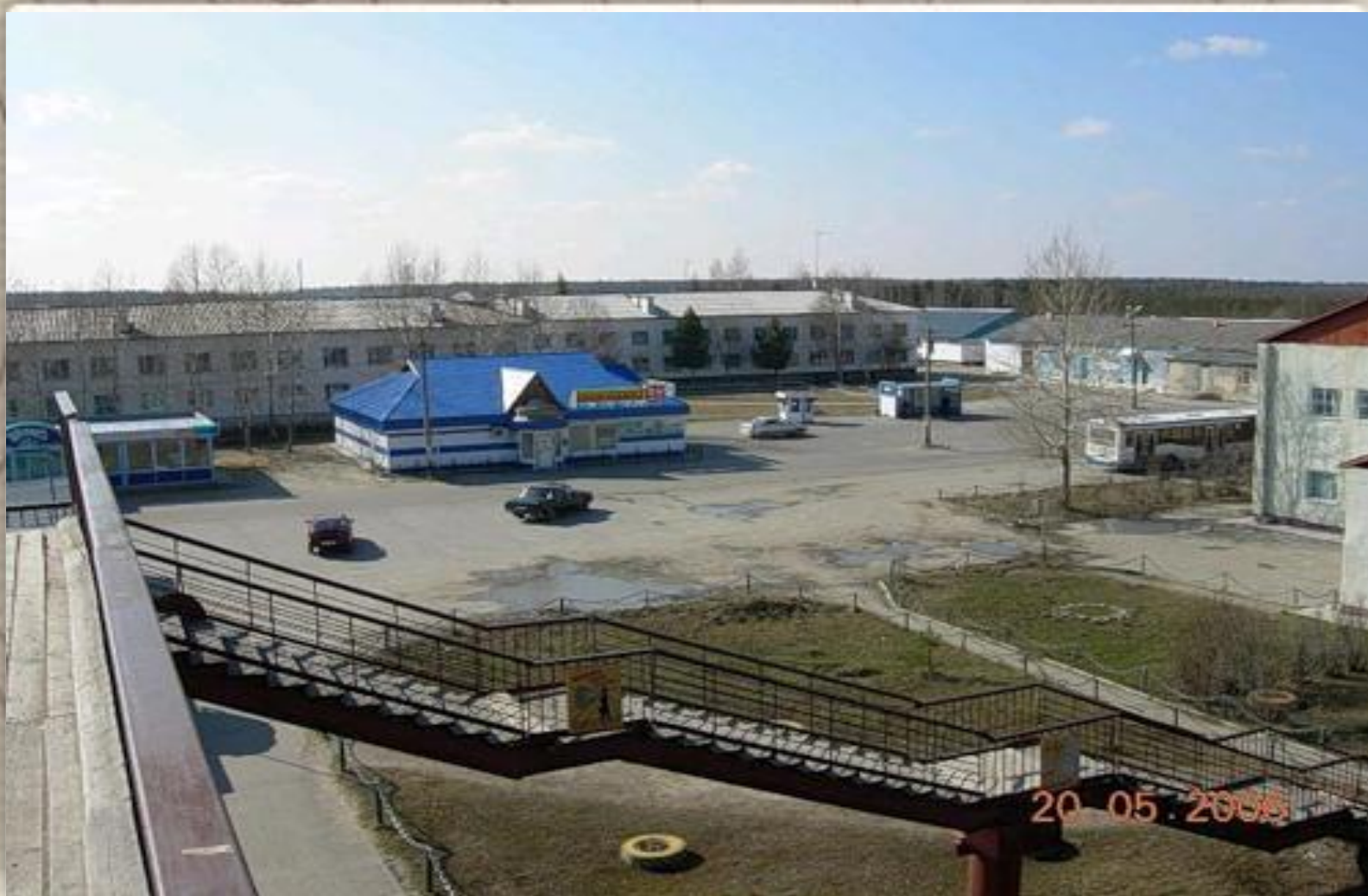
Вид с моста через ж/д пути