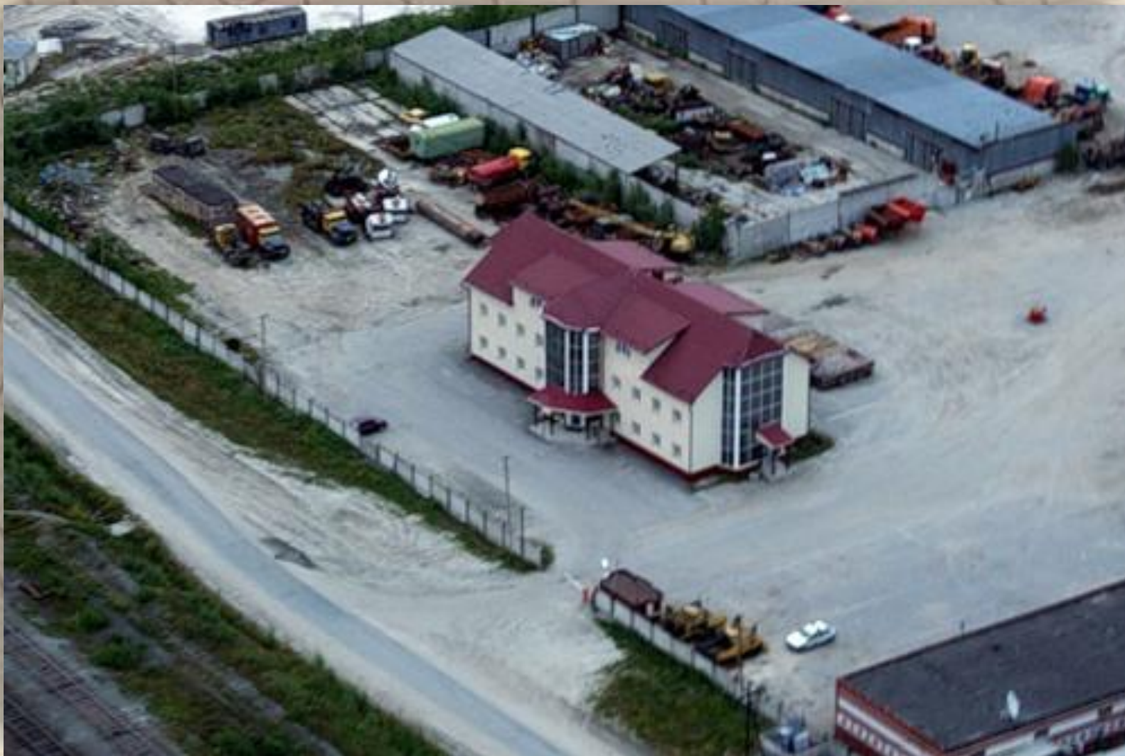
Дорожно- строительное управление