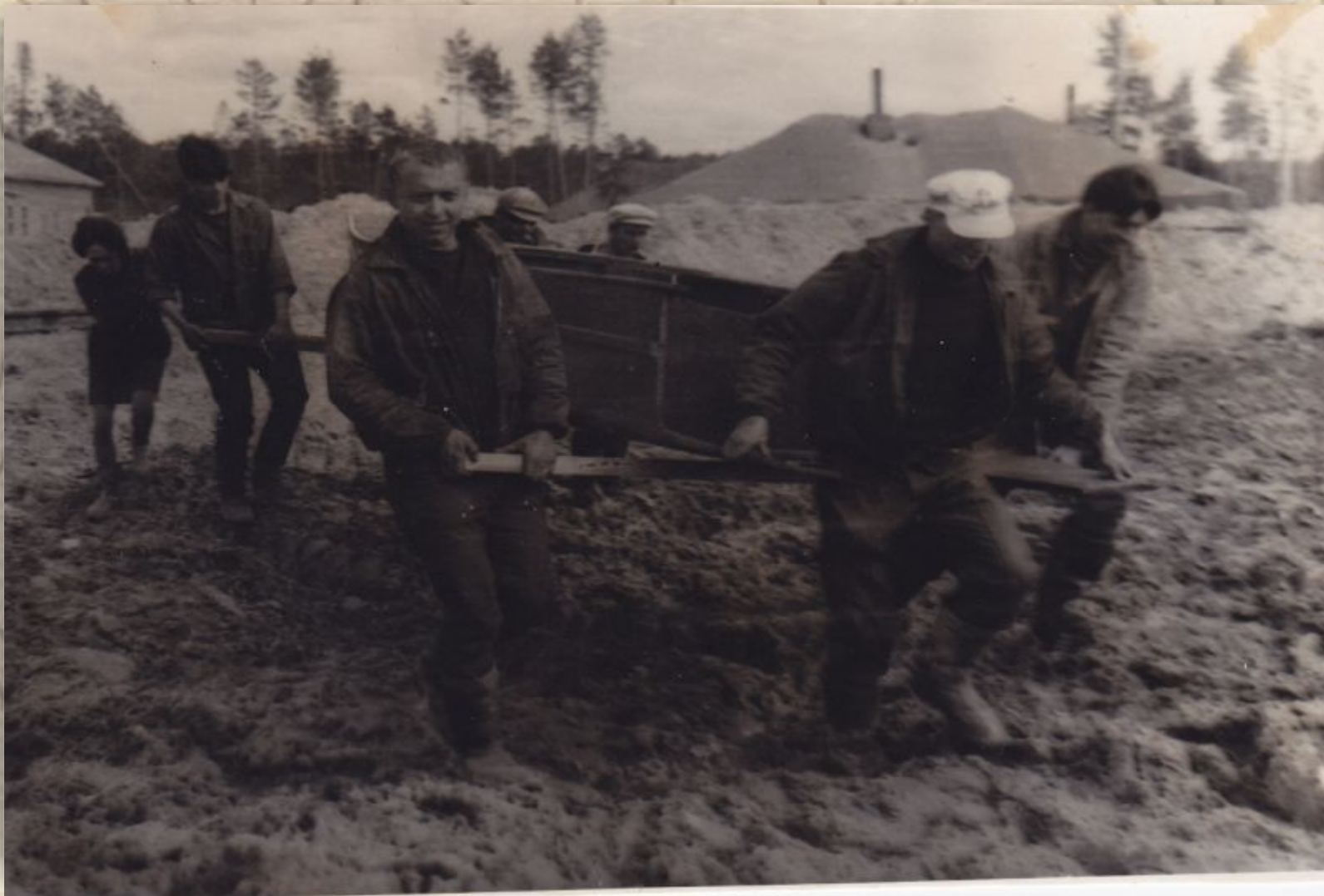
В 1968 года в сентябре высадился первый десант строителей на строительство железной дороги Тюмень-Сургут-Нижневартовск.