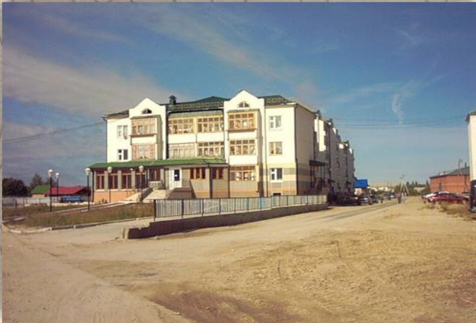
Ханты- Мансийский банк