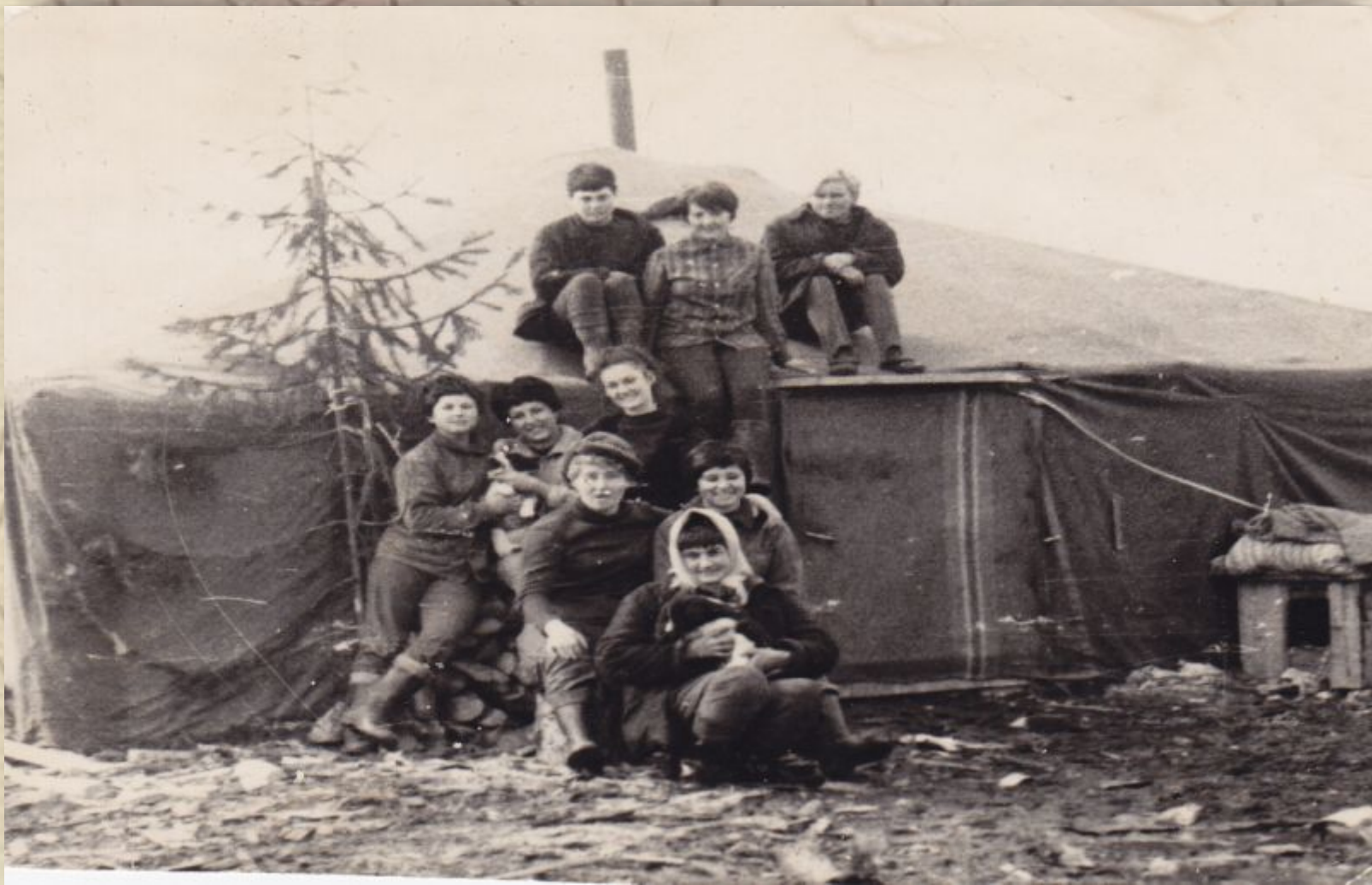
На ударную комсомольско-молодежную стройку ехали со всей страны люди