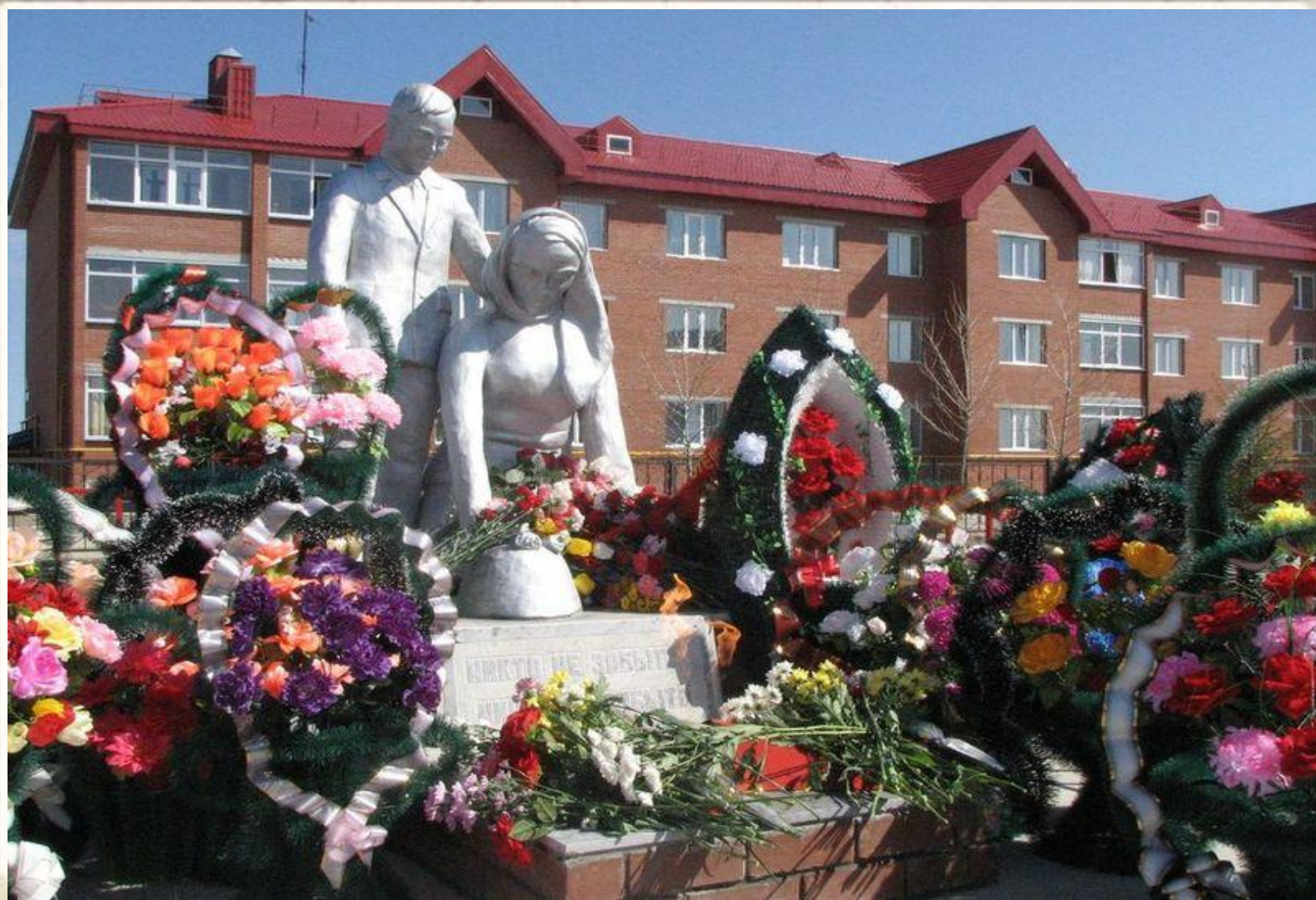
Памятник павшим в боях солдатам. Там проходят демонстрации, и парады в честь Дня Победы.