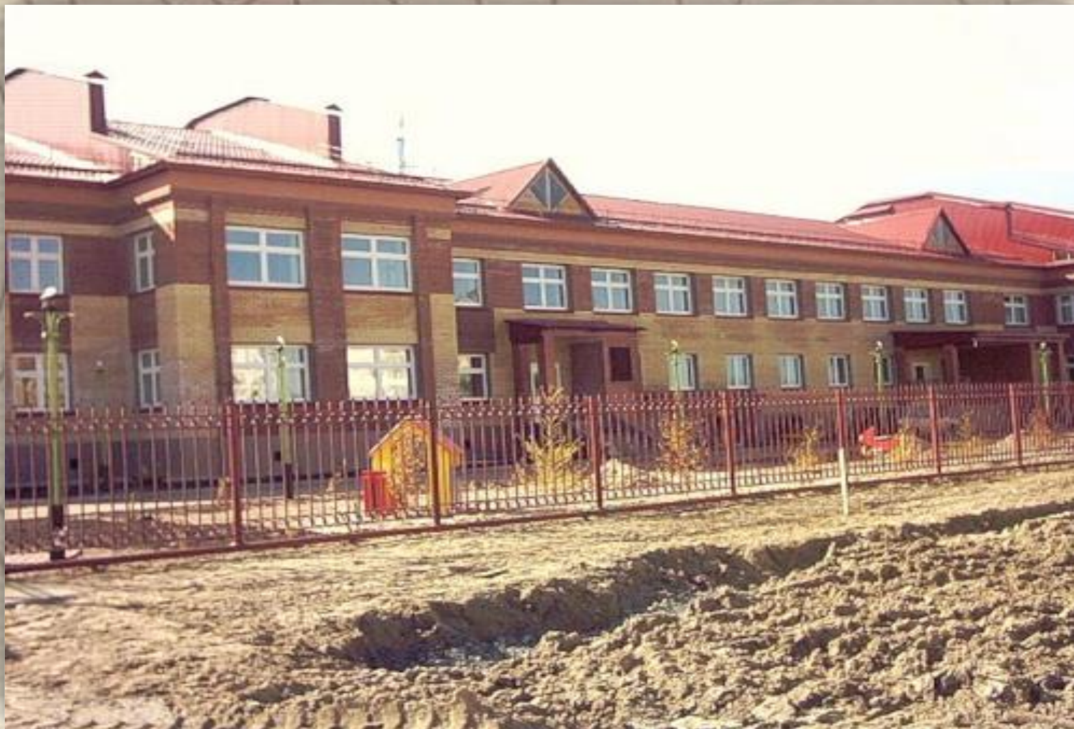
Детский сад «Улыбка»