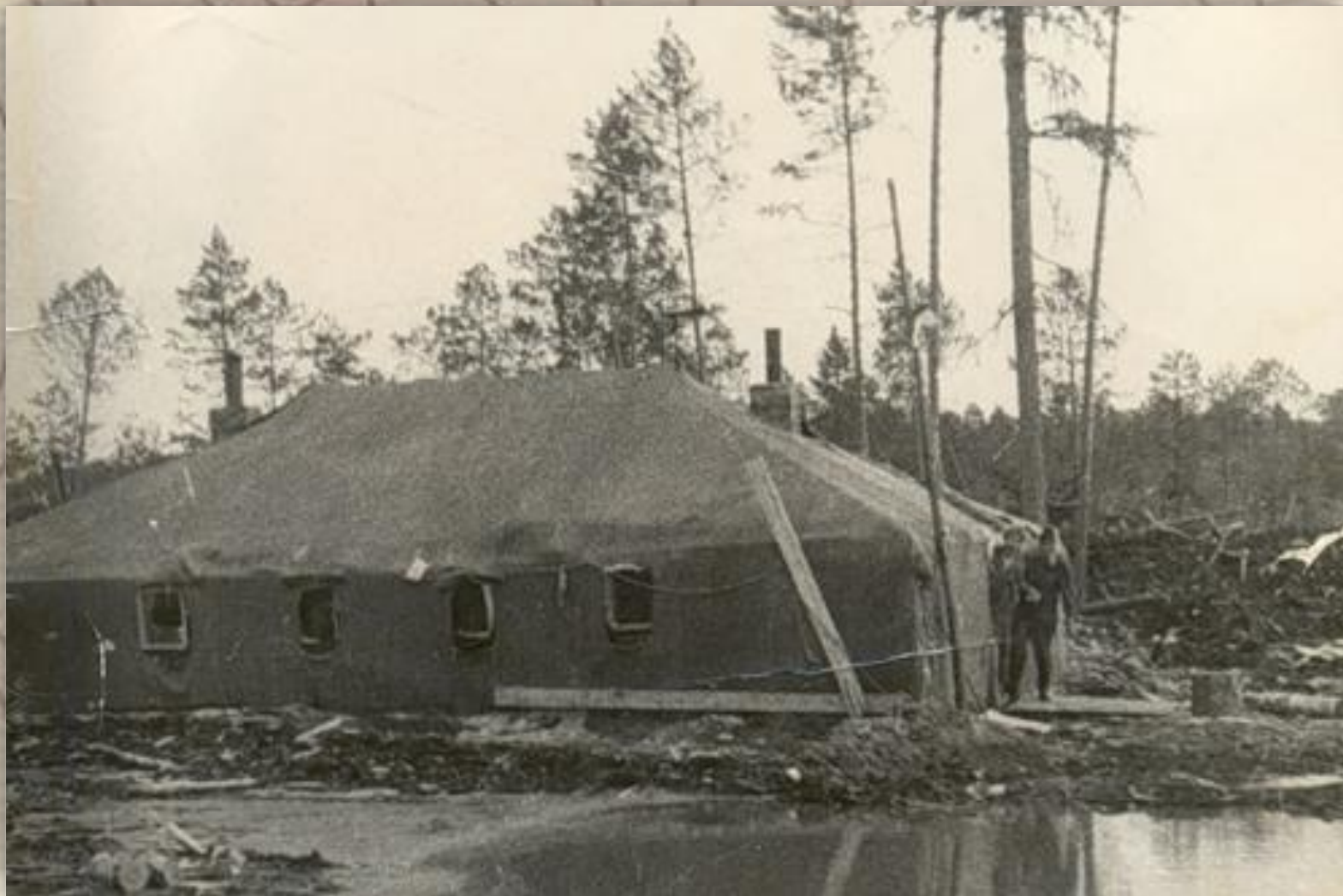
Люди жили в палатках посреди дремучей тайги