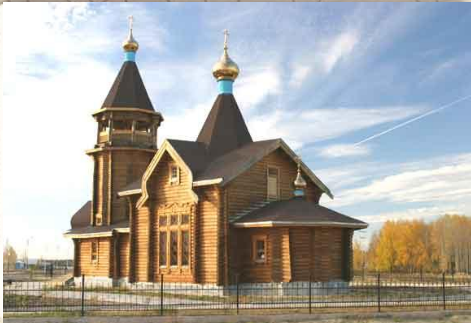
Храм в честь святых апостолов Петра и Павла