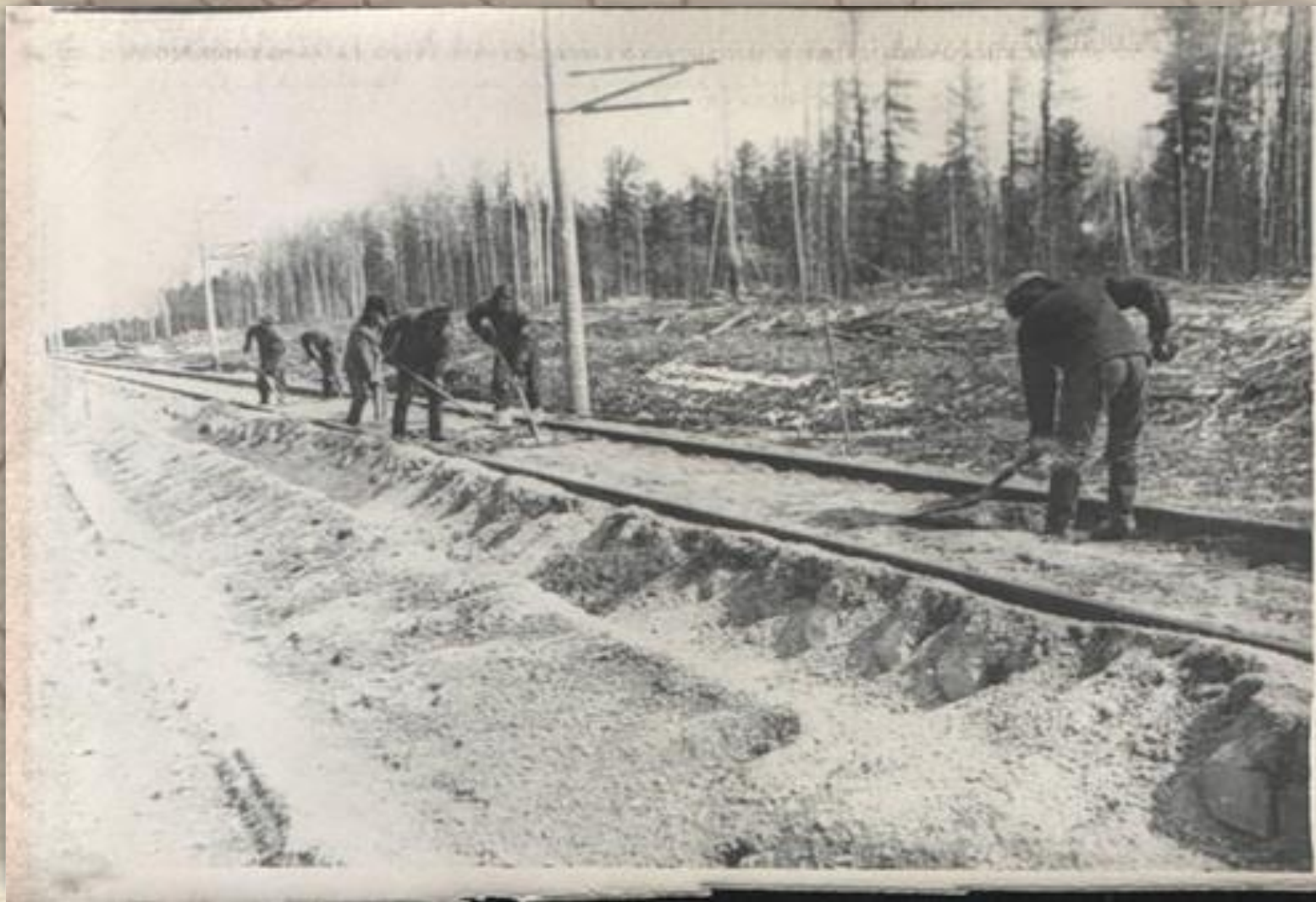
Строительство железной дороги Тюмень-Сургут-Нижневартовск