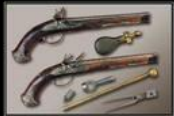
Раньше люди знали, что значит отвечать за свои слова