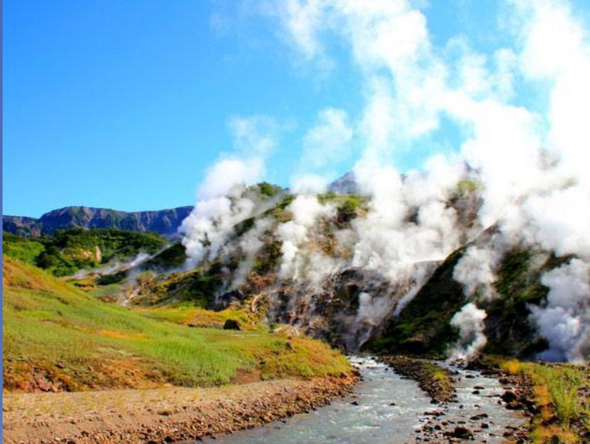
III. Долина гейзеров на Камчатке