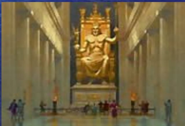
Статуя Зевса в Олимпии