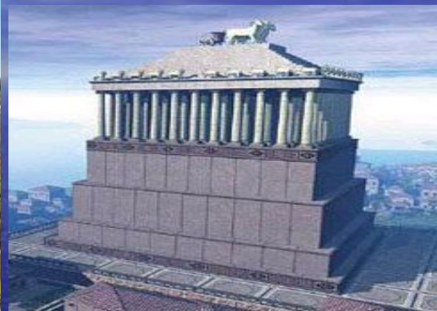
Мавзолей в Галикарнасе