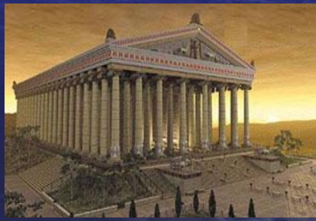
Храм Артемиды в Эфесе