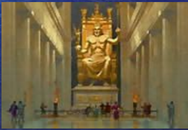
Статуя Зевса в Олимпии