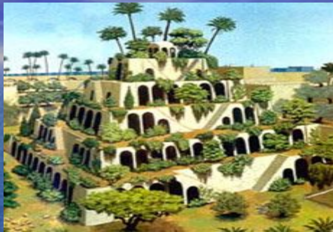
Висячие сады Семирамиды