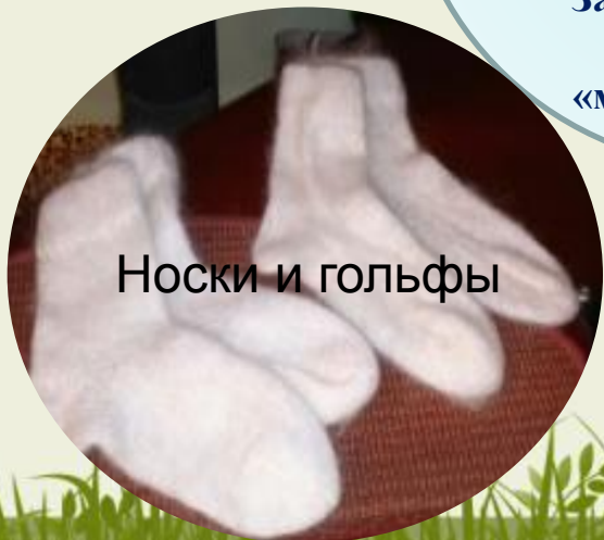
Носки и гольфы

Козий пух используется людьми в лечебных целях и не только с давних времен. Он очень мягкий, нежный на ощупь, легкий и теплый одновременно. За это его в народе называют «мягким золотом».