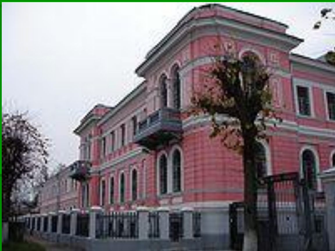
Серпуховский историко-художественный музей