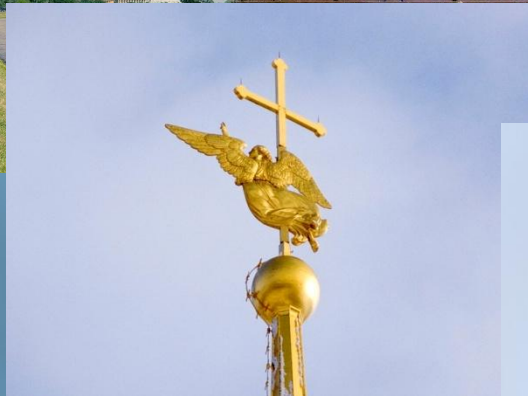
Ангел на шпиле