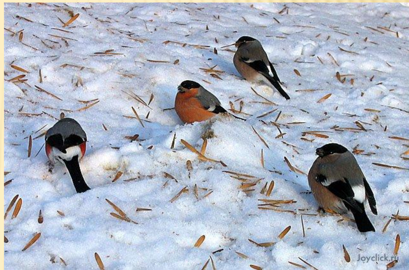
На фоне снега