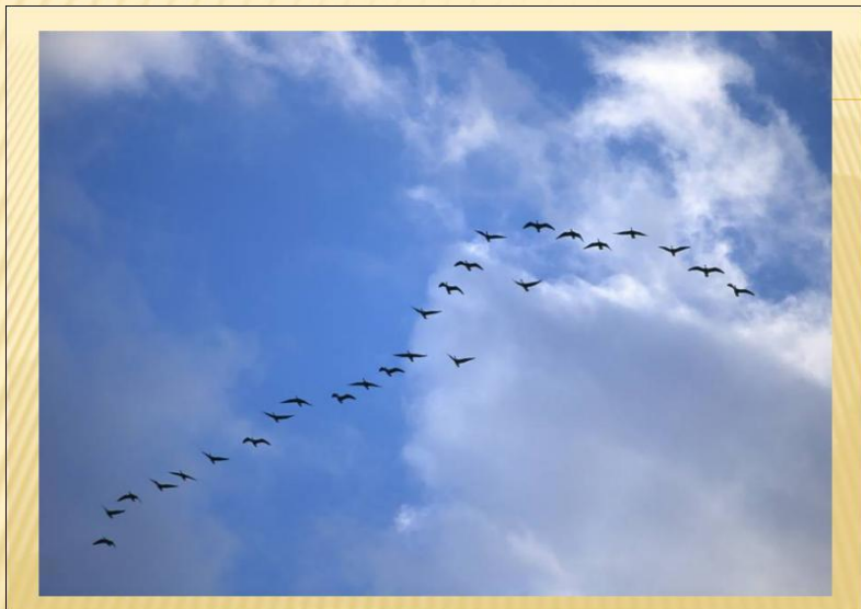
□ на фоне неба