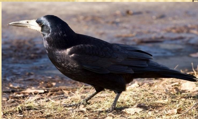
Когда ходят по земле или летят