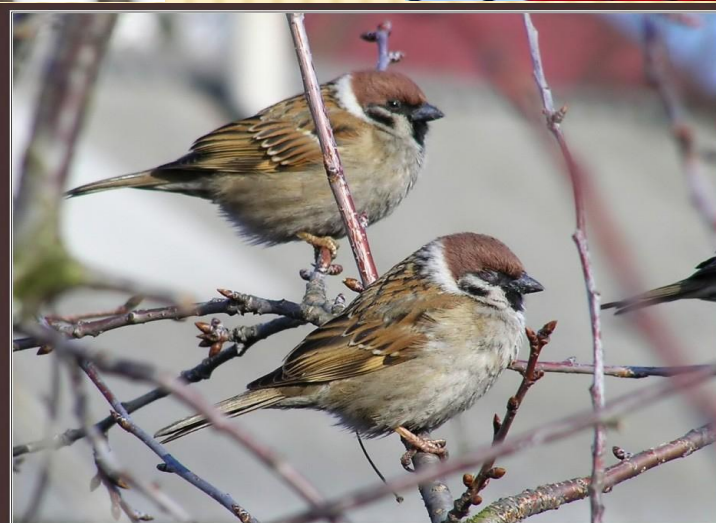
Воробьи полевые ( Passer montanus ) ♂ ♀