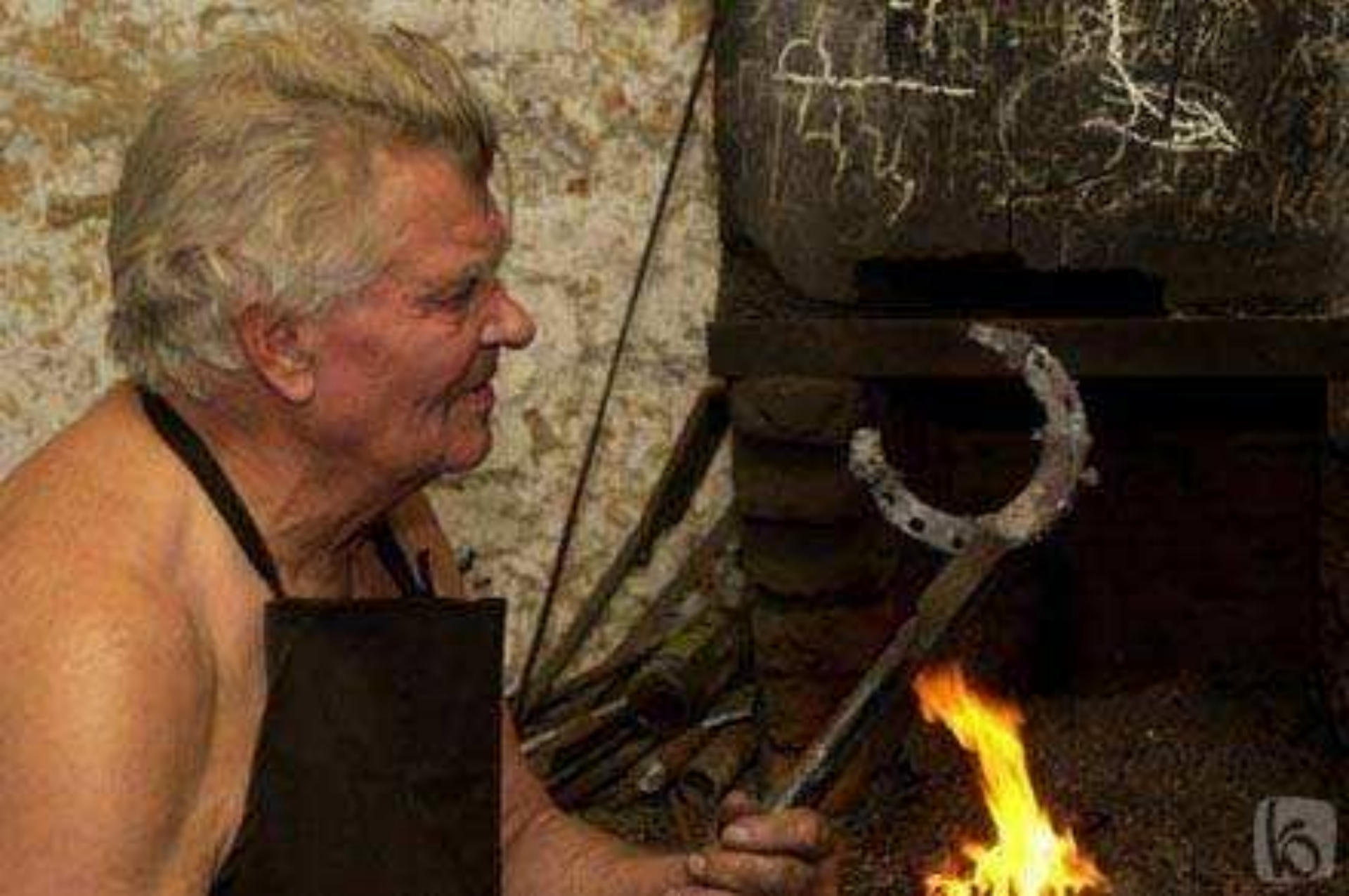
Подковы, орудия труда.