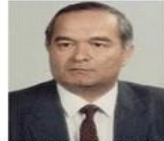
Президент Республики Узбекистан