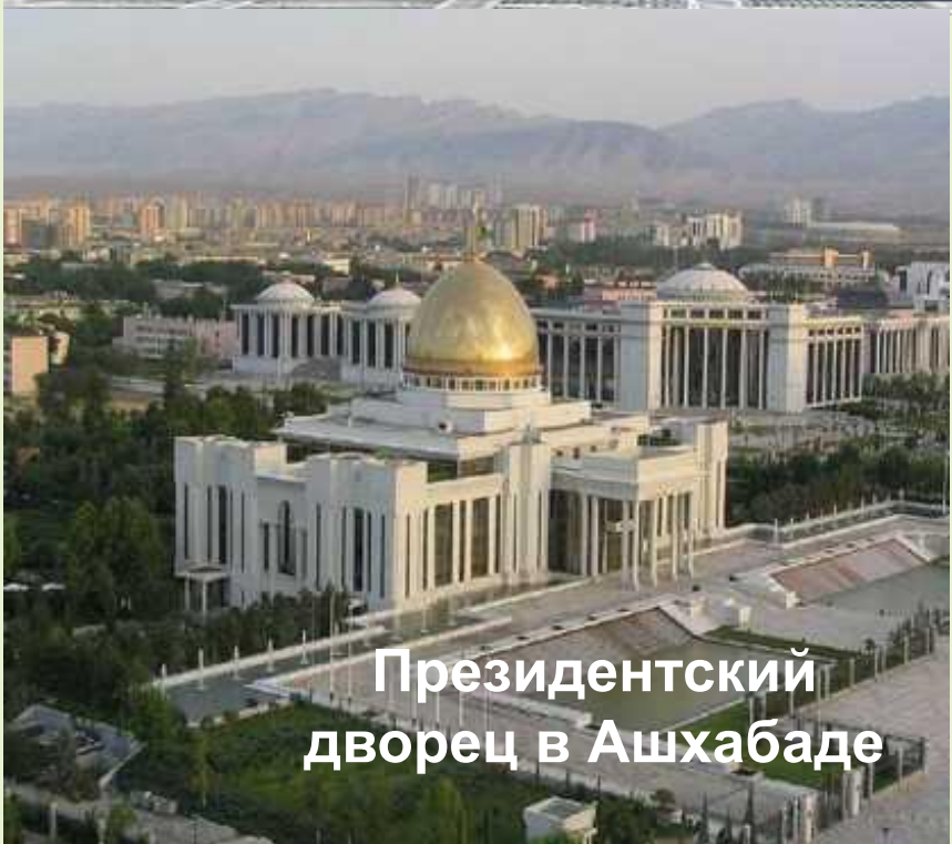
Президентский дворец в Ашхабаде