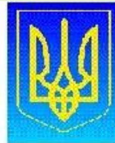
Герб Украины Президент Украины