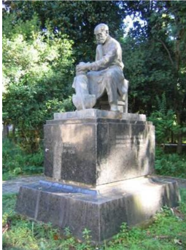
Павлов с собакой