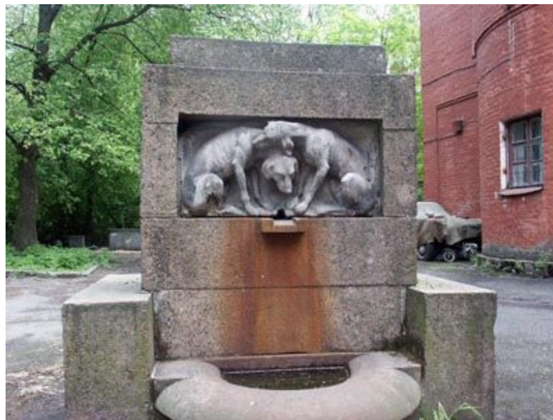
Памятник собакам служившим медицине (Института Павлова в СПб.)