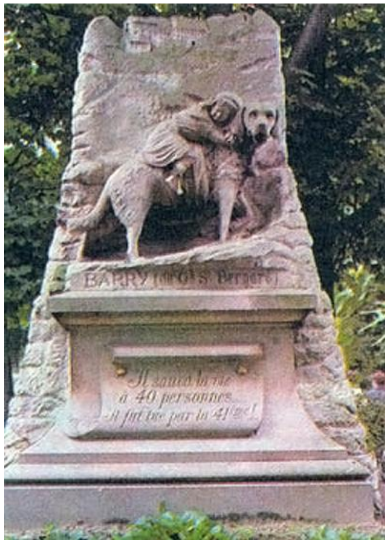
Смелому Барри в Париже ( спас 40 чел. В горах)