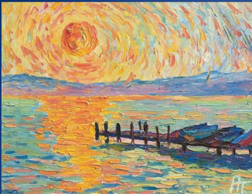
Айвазовский «Закат солнца в Феодосии»