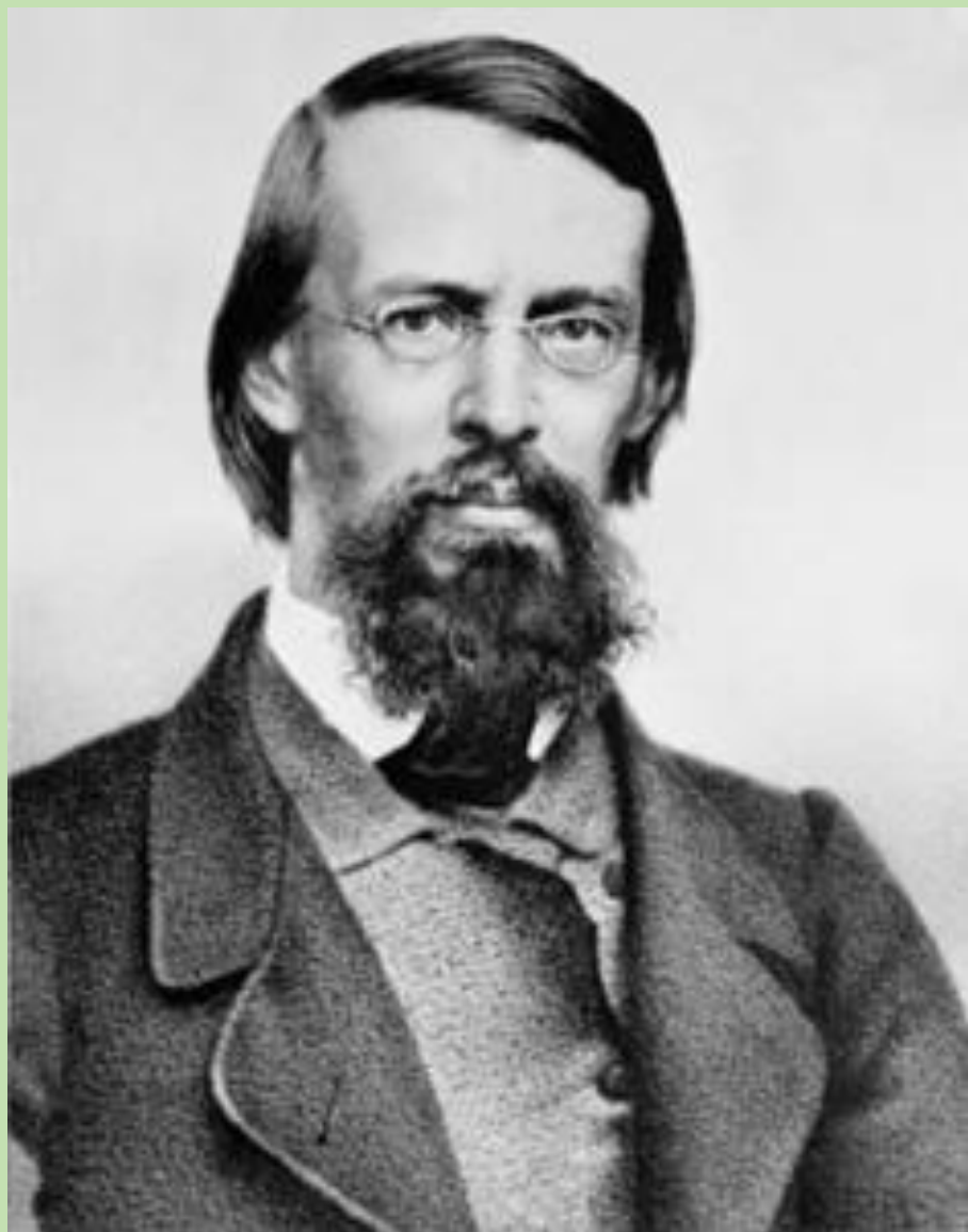
Аполлон Александрович Майков