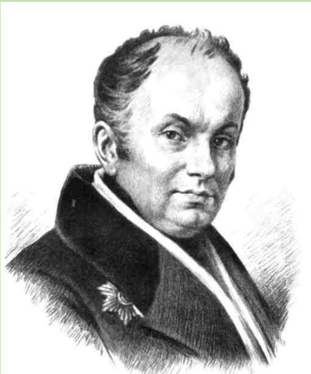
Жуковский Василий Андреевич