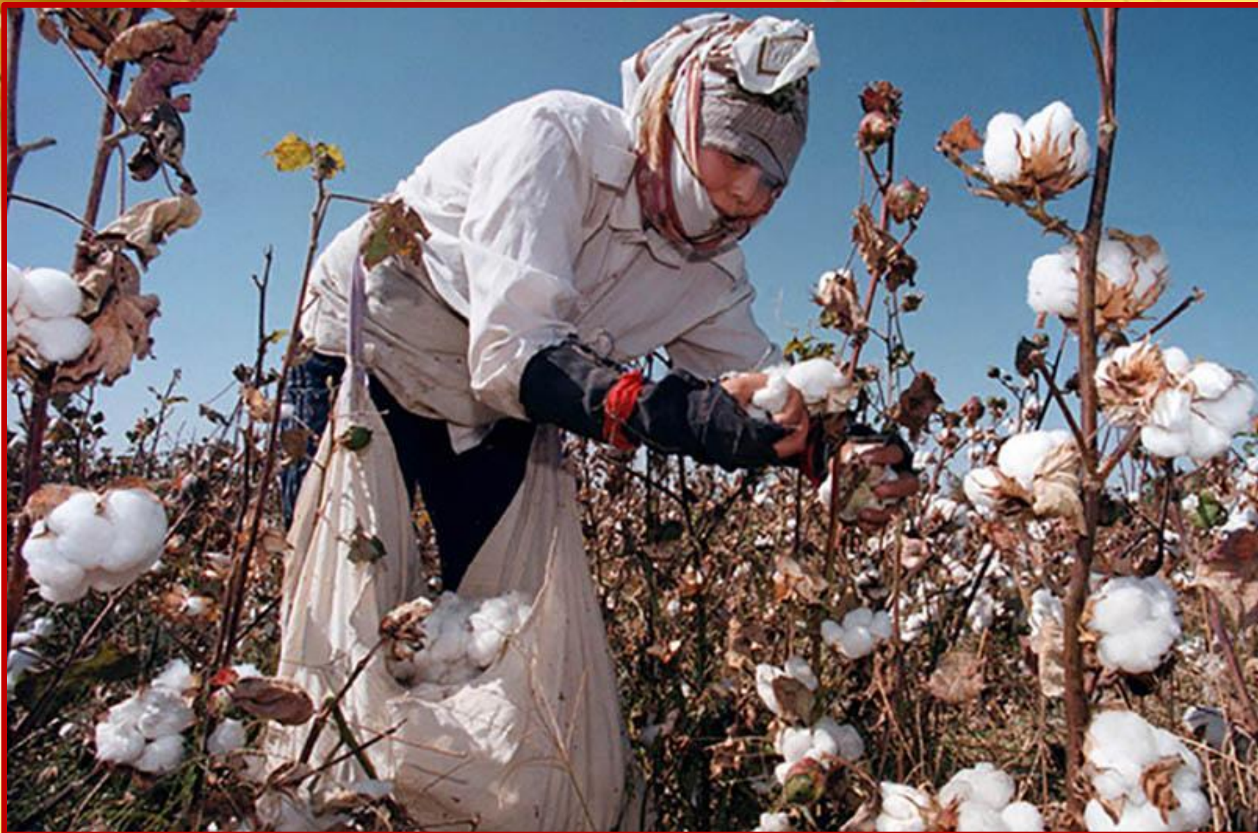
Уборка хлопка в ручную