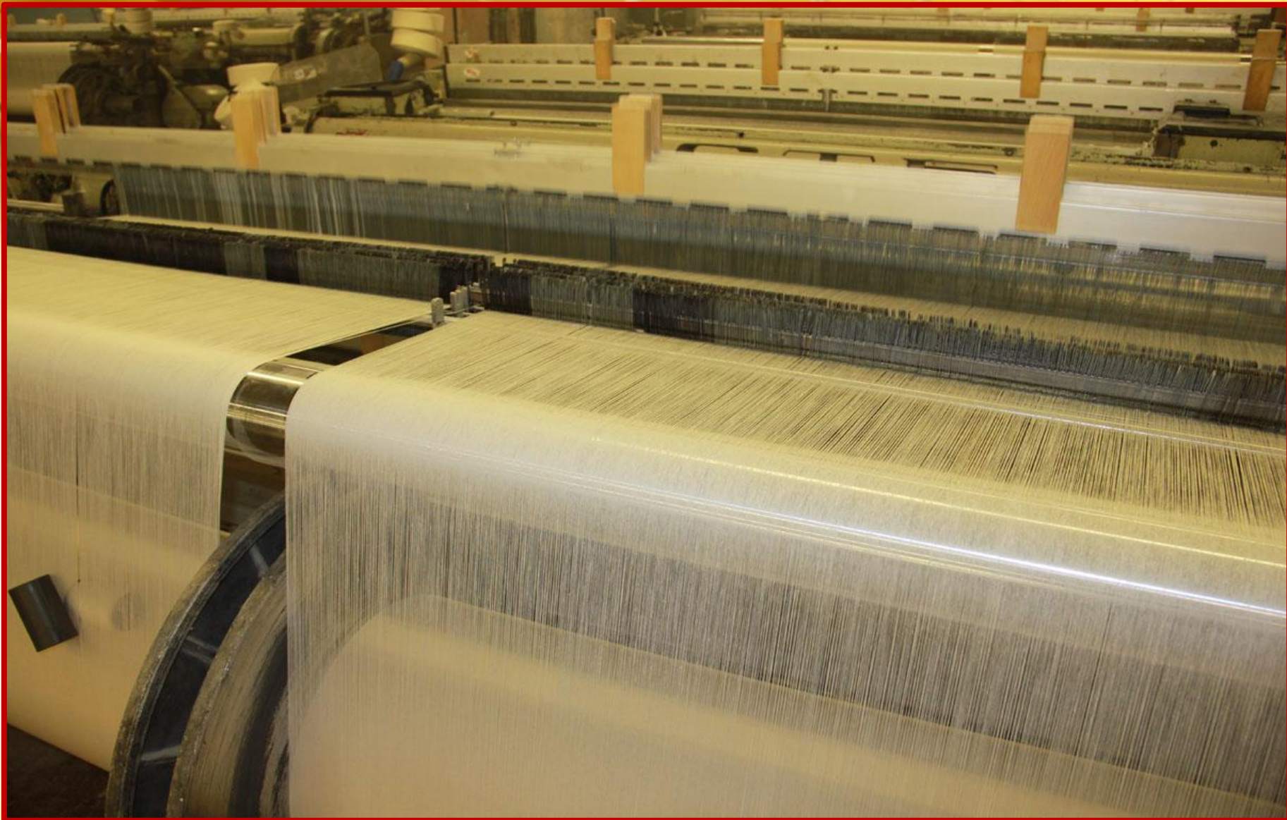
Ткацкий станок Этот станок ткёт ткань