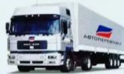
ТЯГАЧ С ПРИЦЕПОМ