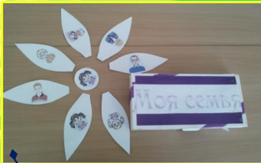
Д/И «Моя семья»