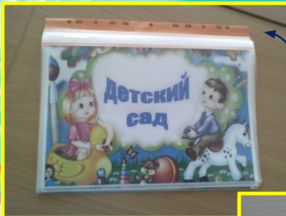
Тематический альбом «Детский сад»