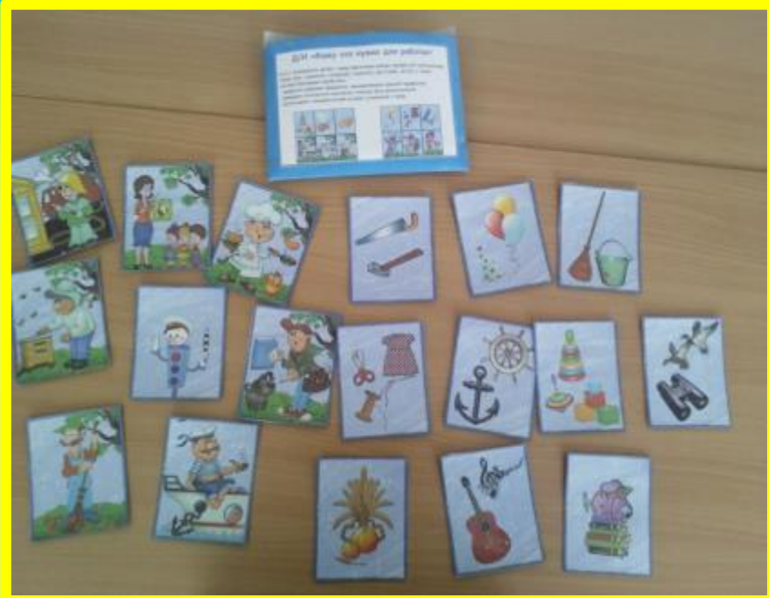
Д/И Кому что нужно для работы»