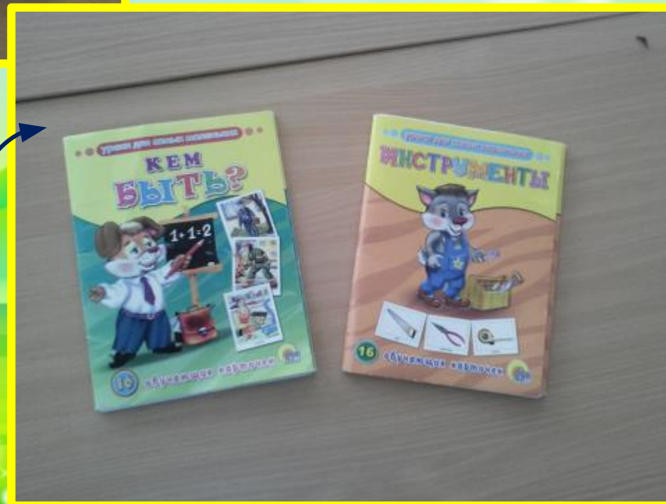
Набор открыток «Кем быть?», «Инструменты»