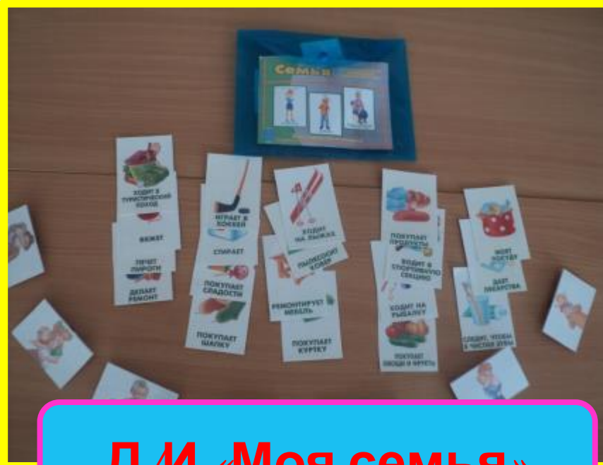
Д/И «Моя семья»