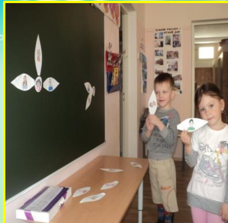
Д/И «Семейный портрет»