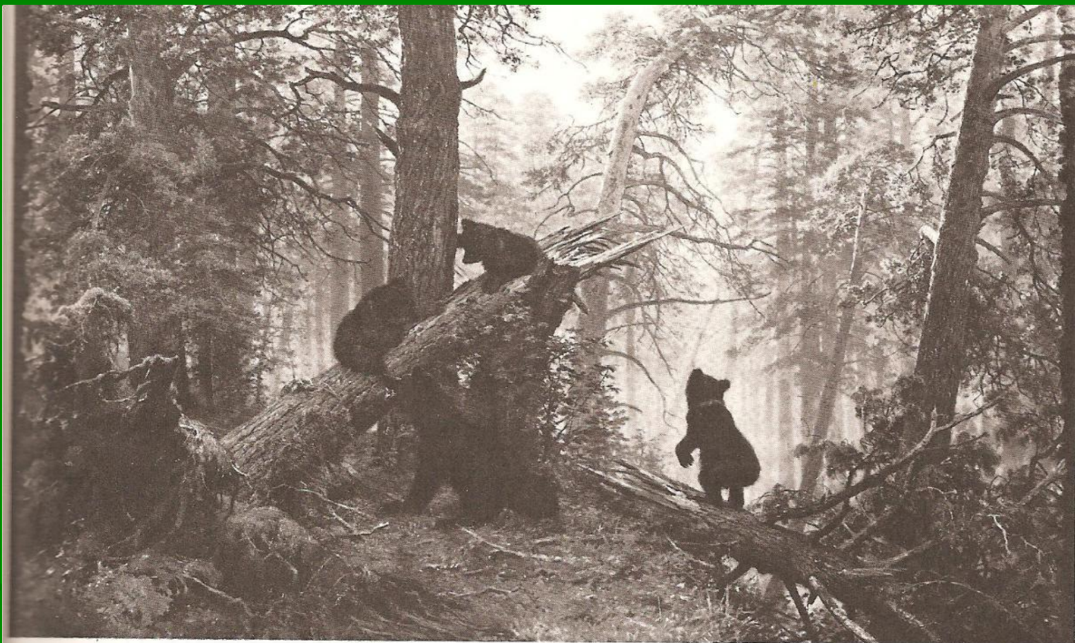
И. И. Шишкин. Утро в сосновом лесу. 1889.