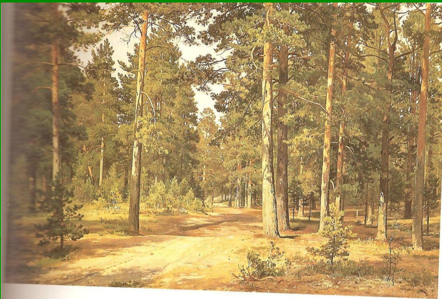
И. И. Шишкин. Сосновый лес. 1887.