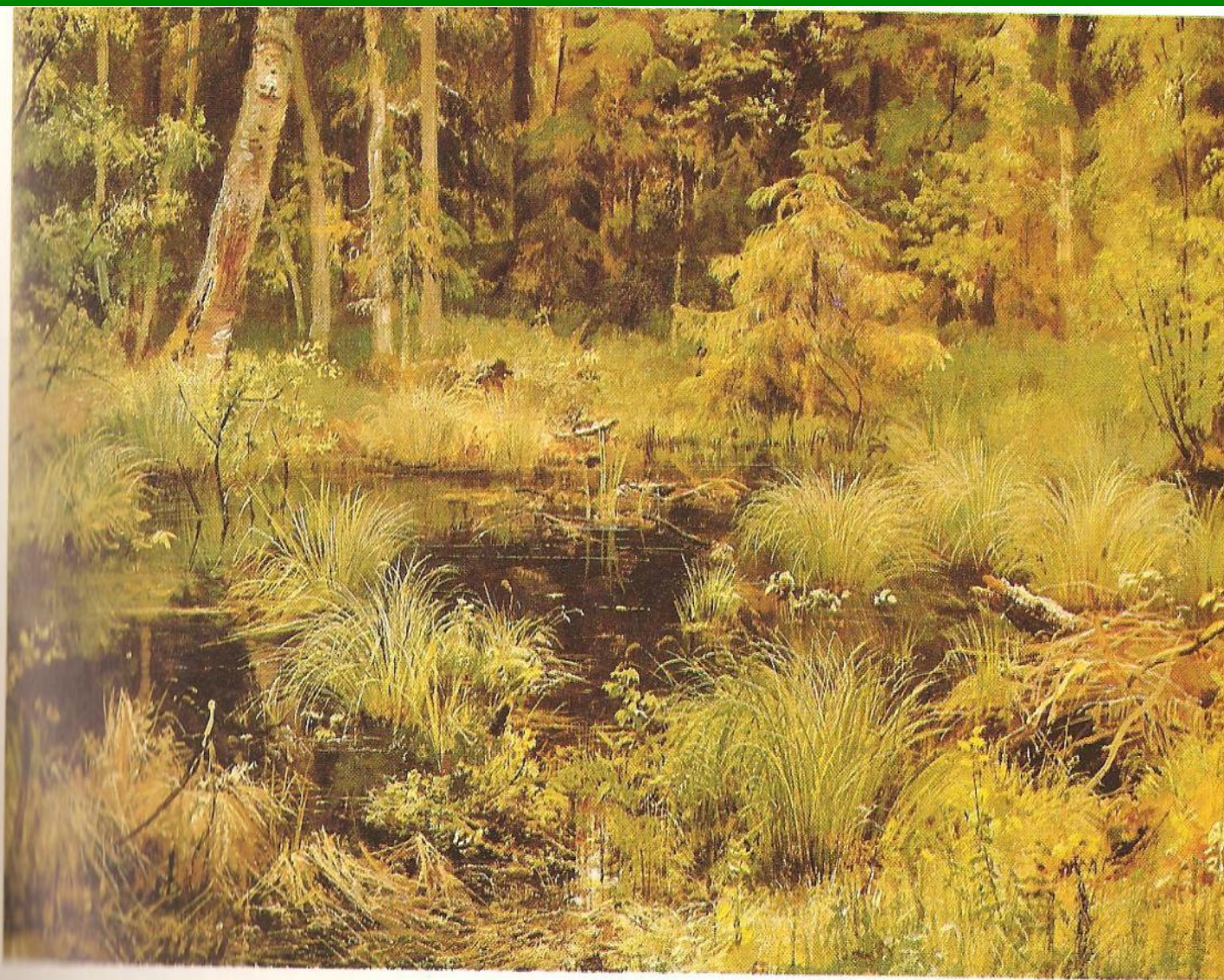
И. И. Шишкин.