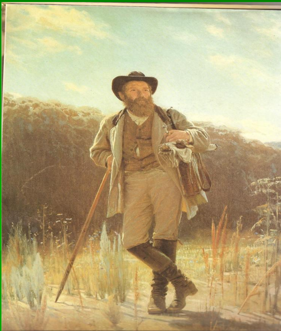
Иван Иванович Шишкин (1832 -1898)