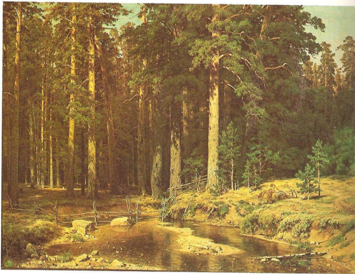
И. И. Шишкин. Корабельная роща. 1898.