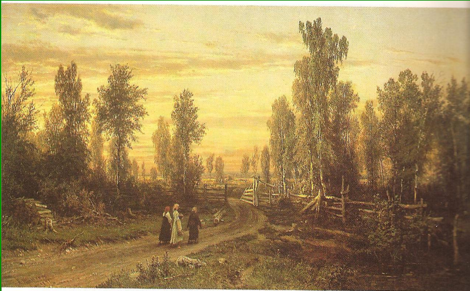
И. И. Шишкин. Вечер. 1871.