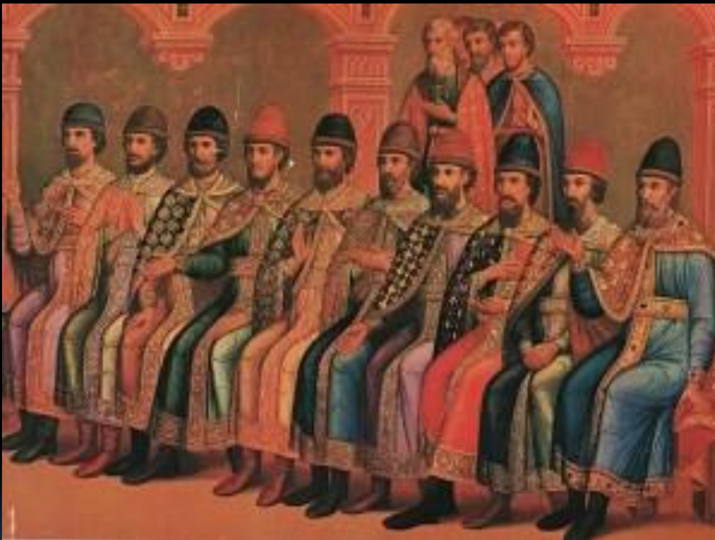
У князя Владимира было 13 сыновей и 10 дочерей. Великий князь Владимир Святославович с сыновьями. Роспись восточной стены Грановитой палаты. 1882