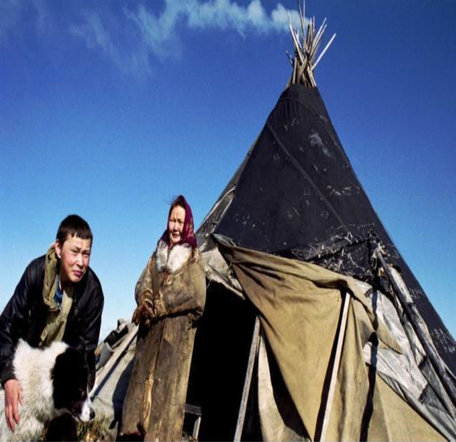
www.fotodom.ru Z006-2834 Anzenberger На фото - местные жители.