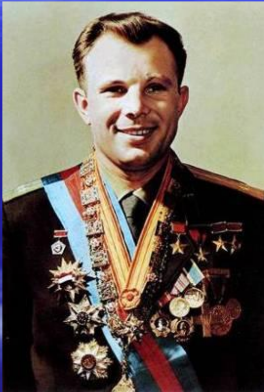
Юрий Алексеевич Гагарин