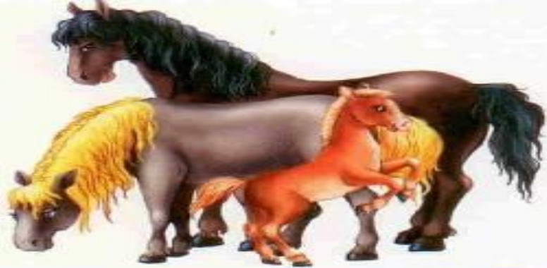
Лошадь — конь — жеребёнок