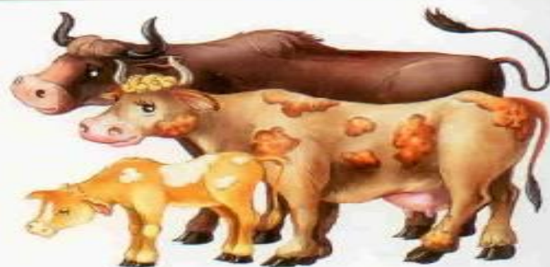
Корова — бык — телёнок