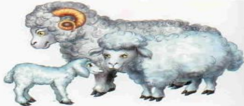
Овца — баран — ягнёнок