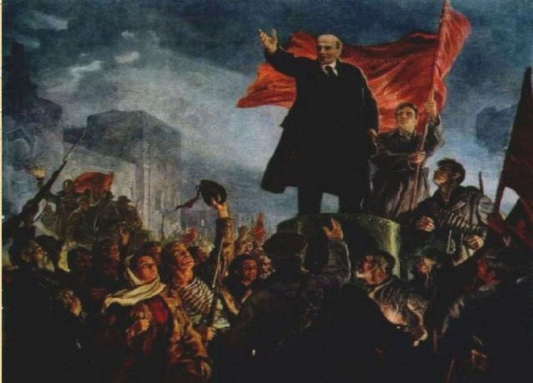
Октябрьская революция 1917г. Декреты о мире и земле