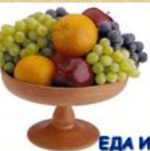
ЕДА И НАПИТКИ