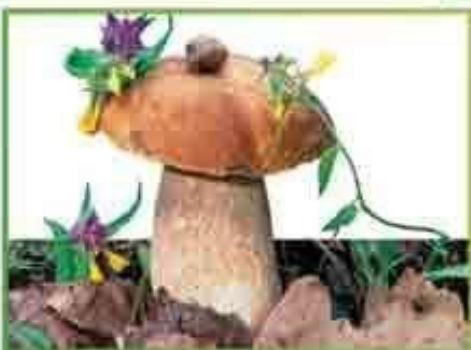
белый гриб (еловый)