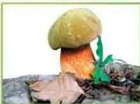
белый гриб (дубовый)