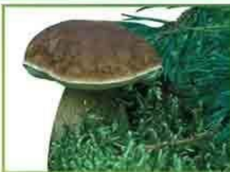
белый гриб (сосновый)