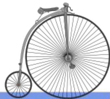
1870 большееколёсный велосипед Джеймс Старли Франция