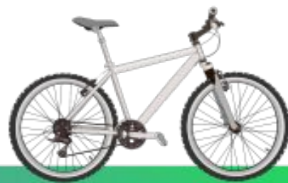
Середина 1970-х горный велосипед -- США