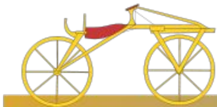
1818 дрезина Карл фон Дрез Германия