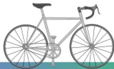
1960-е гоночный велосипед -- США