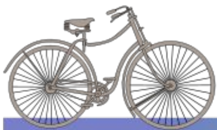
1885 безопасный велосипед Джон Кемп Старли Англия