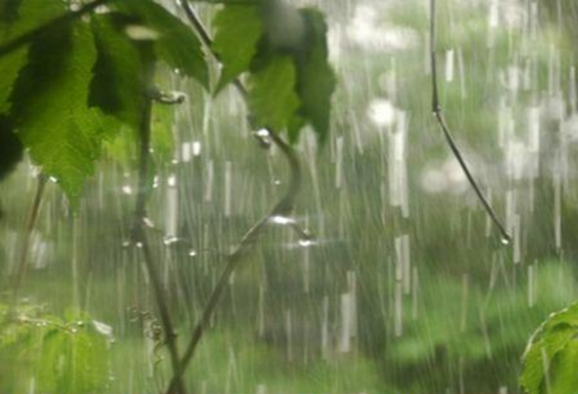
С молодой травой, первой майской грозой,