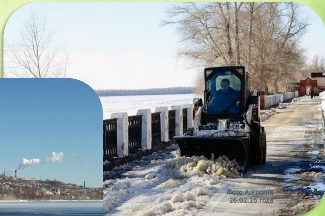
26.02.16 года

Наш любимый город Вольск весной преобразается. Хотя в самом начале месяца везде еще лежат сугробы. Робкие лучики солнышка уже потихоньку набирают силу, поэтому тут и там сугробы начинают подтаивать, но до настоящей оттепели еще далеко.