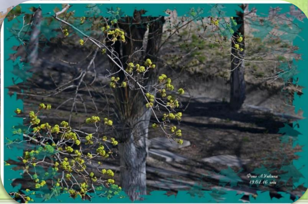
19.04.16 года