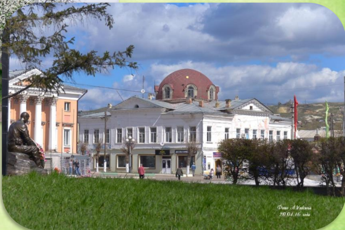
20.04.16 года