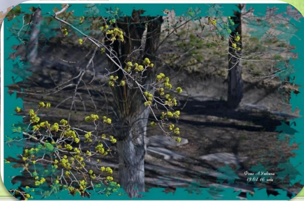
19.04.16 года