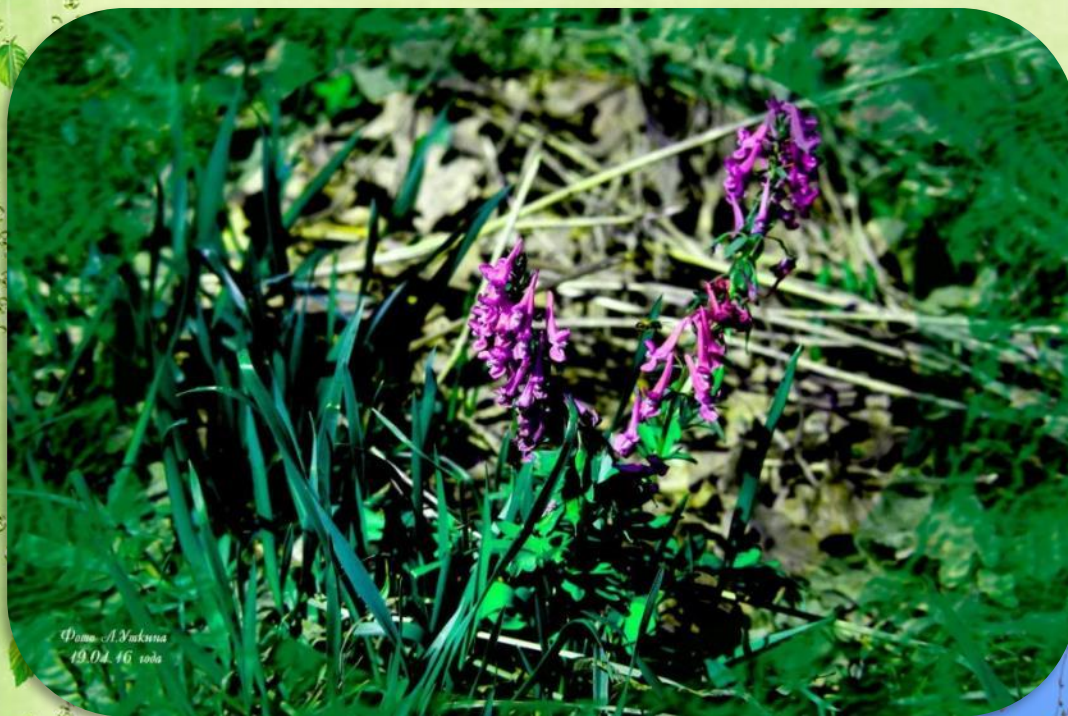
19.04.16 года

Апрель станет вестником расцвета зелени, во время которого все стремительно зеленеет. Первые цветочки, желтые головки мать-и мачехи показали из под земли.