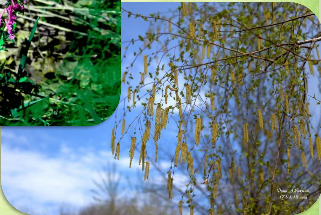
17.04.16 года