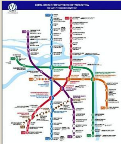
СХЕМА МЕТРО ПХОЖА НЕ ПХОЖКО НА РАЗНОЦВЕТНУЮ «МНОГОНОЖКУ» ТОЛЬКО, ПО ПРАВДЕ, КАЖДАЯ «НОЖКА» - ДЛЯ ЭЛЕКТРИЧКИ, РЕЦСОП