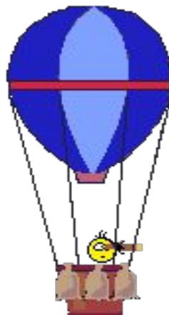
Воздушного шара с корзиной